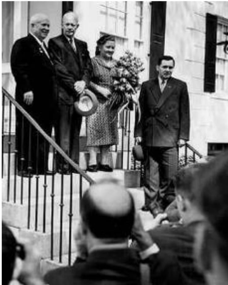
Визит Н.С.Хрущева в США. 1959 г.

Смерть Сталина совпала по времени с приходом к власти в США Д.Эйзенхауэра. 16.10.1953 г. он обратился к СССР с призывом изменить атмосферу международных отношений, установить мир в Корее, Индокитае, ограничить производство ядерного оружия. В 53-54 гг. были подписаны мирные соглашения по Корее и Индокитаю. Польша, ЧССР и СССР предложили созвать общеевропейское совещание по безопасности и сотрудничеству. В 1955 г. был подписан мирный договор с Австрией.