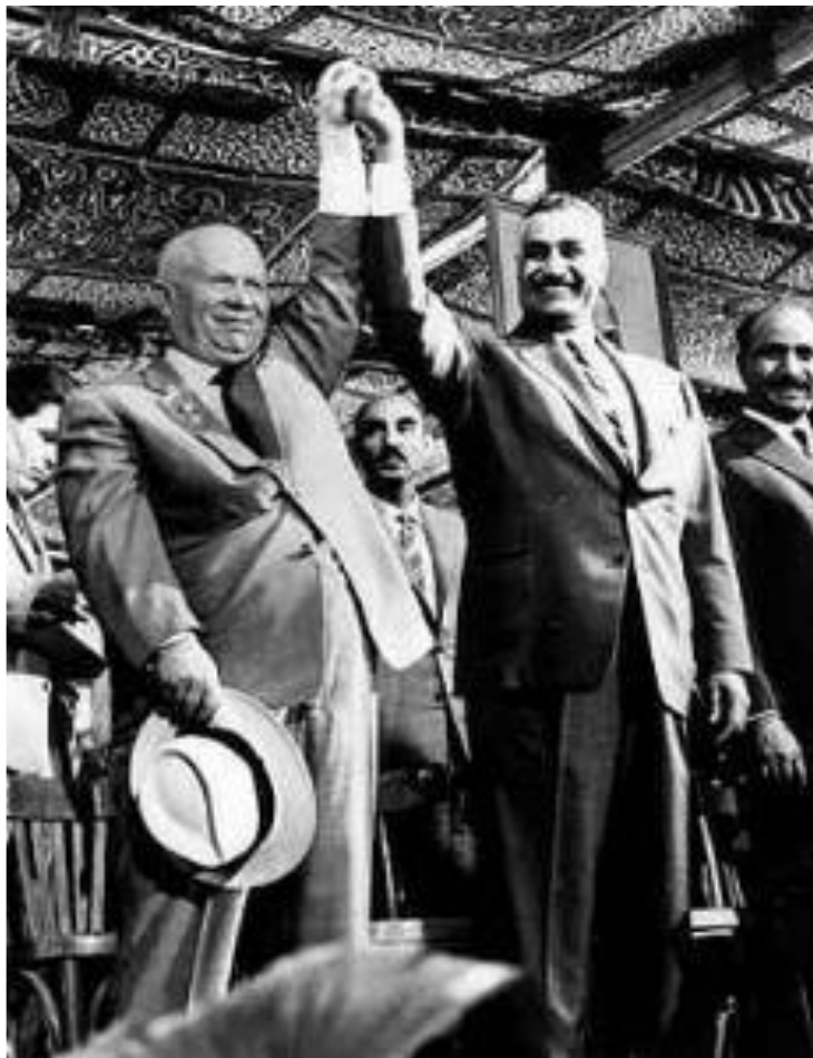
Н.С.Хрущев и Г.А.Насер.

Укреплялись отношения со странами-лидерами Движения-Индией, Индонезией, Египтом. Их руководители нанесли визиты в СССР, им оказывалась военная и экономическая помощь. СССР поставлял оружие в страны Азии, Африки, Латинской Америки. При его поддержке Египет национализировал Суэцкий канал, Индонезия освободила о. Тимор. В ответ США начали поддержку Израиля и Пакистана. Это привело к новым конфликтам.