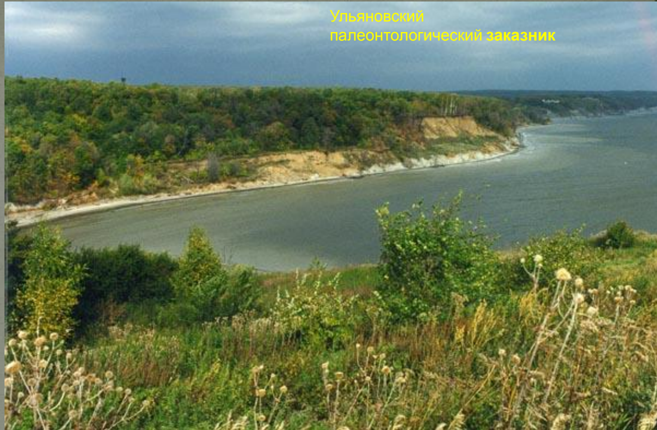
Ульяновский палеонтологический заказник

Государственными природными заказниками являются территории (акватории), имеющие особое значение для сохранения или восстановления природных комплексов или их компонентов и поддержания экологического баланса. Для целей познавательного туризма особое значение имеют комплексные заказники, в которых туристов знакомят с редкими видами животного и растительного мира, живописными пейзажами.