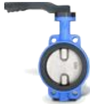
Дисковые поворотные затворы