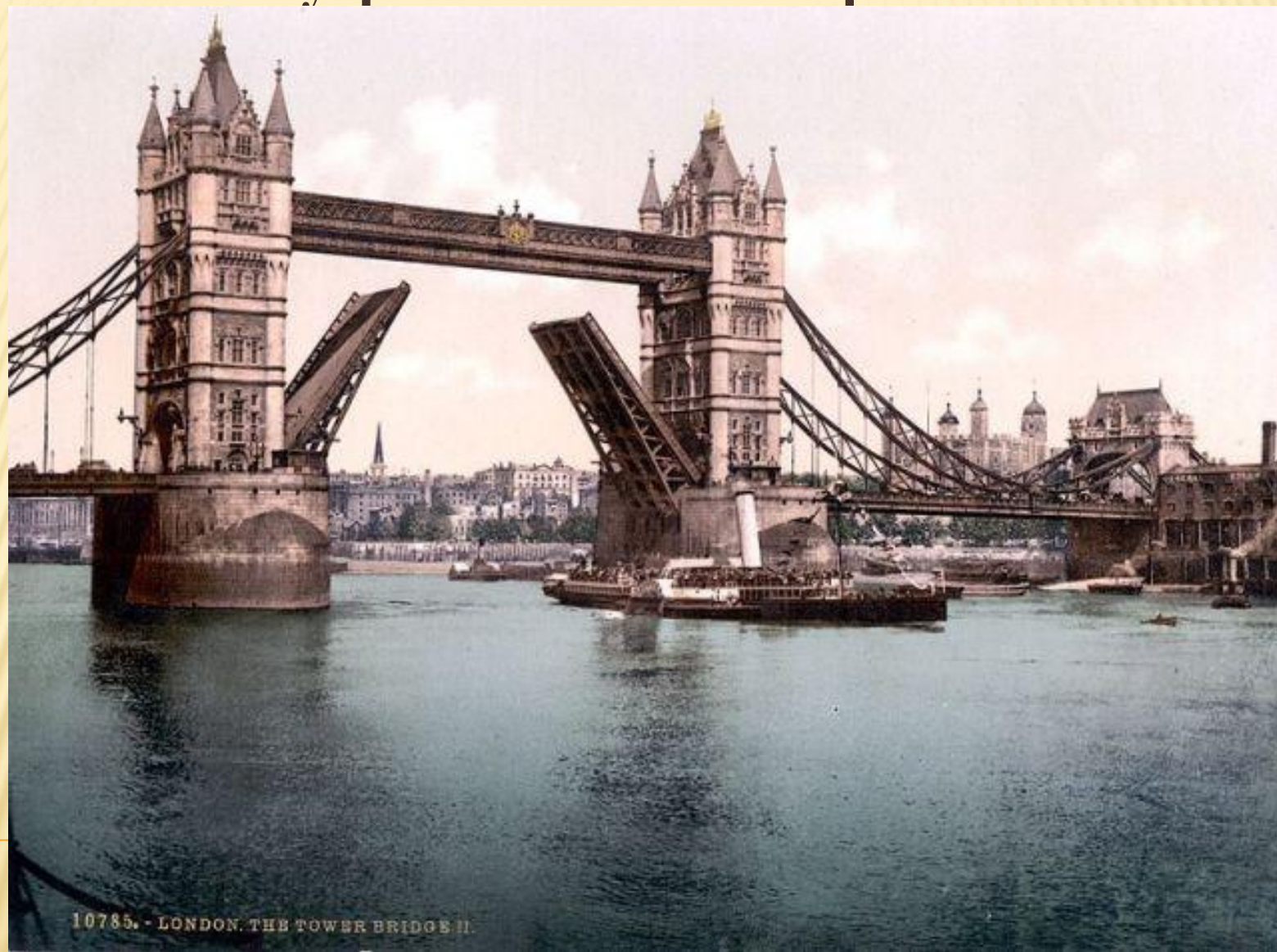
ФОТО 1900 ГОДА