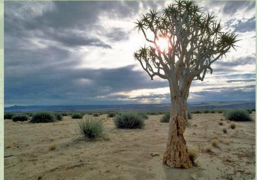
Алоэ в пустыне Калахари.

На юге материка располагаются разрушенные Капские горы , а на юго-востоке - плосковершинные разрушенные Драконовы горы . На востоке лежит низменная прибрежная Мозамбикская равнина, в центре - котловина, которую занимает пустыня Калахари , а на западном побережье - пустыня Намиб.