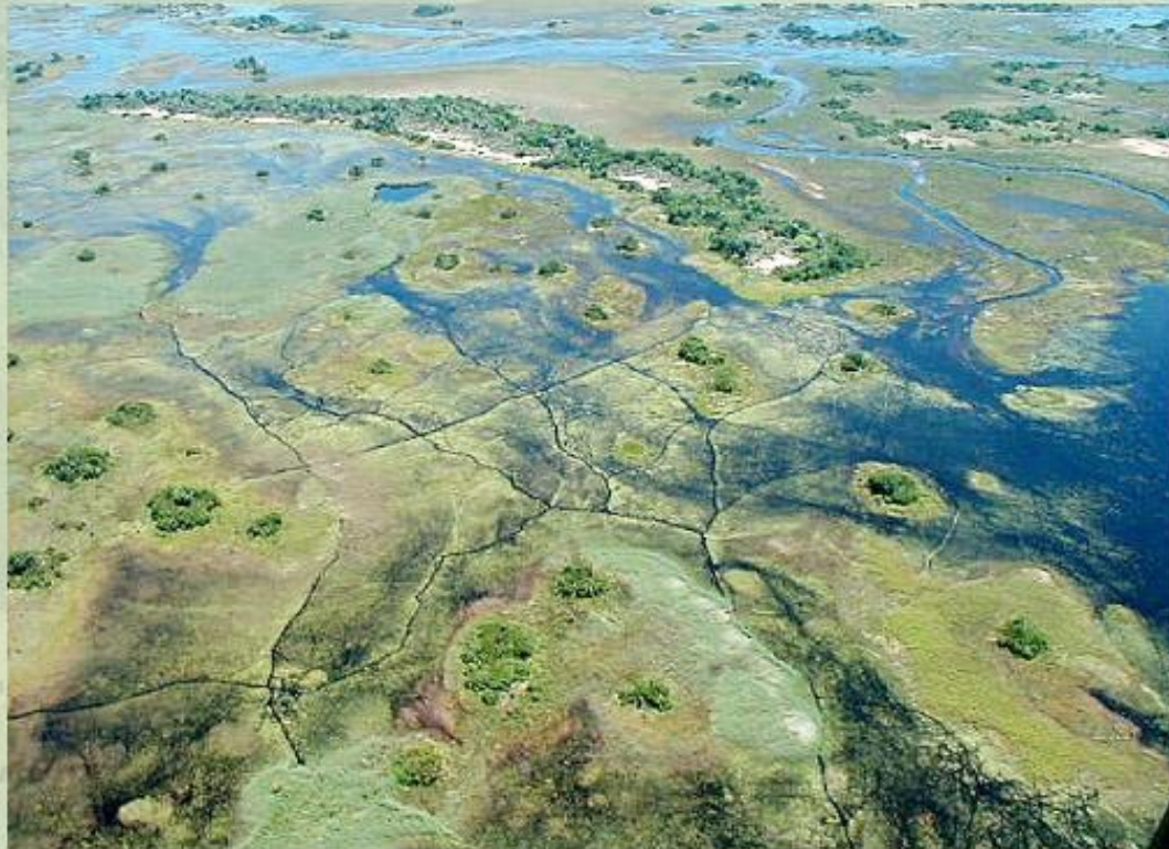
Дельта реки Окаванго.

Заболоченная дельта реки Окаванго (Ботсвана) граничит на востоке с влажными тропическими лесами.