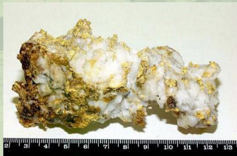
Золотой самородок, добытый в ЮАР.

Южная Африка - один из самых богатых в мире районов добычи полезных ископаемых. Страны региона - лидеры на мировых рынках золота и платины (ЮАР), алмазов (ЮАР, Ботсвана) и урана (Намибия). В ЮАР богаты месторождения каменного угля, образовавшегося миллионы лет назад в условиях влажного климата. В большинстве стран региона горнодобывающая промышленность составляет основу экономики.