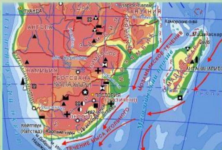
Минеральные ресурсы юга Африки.