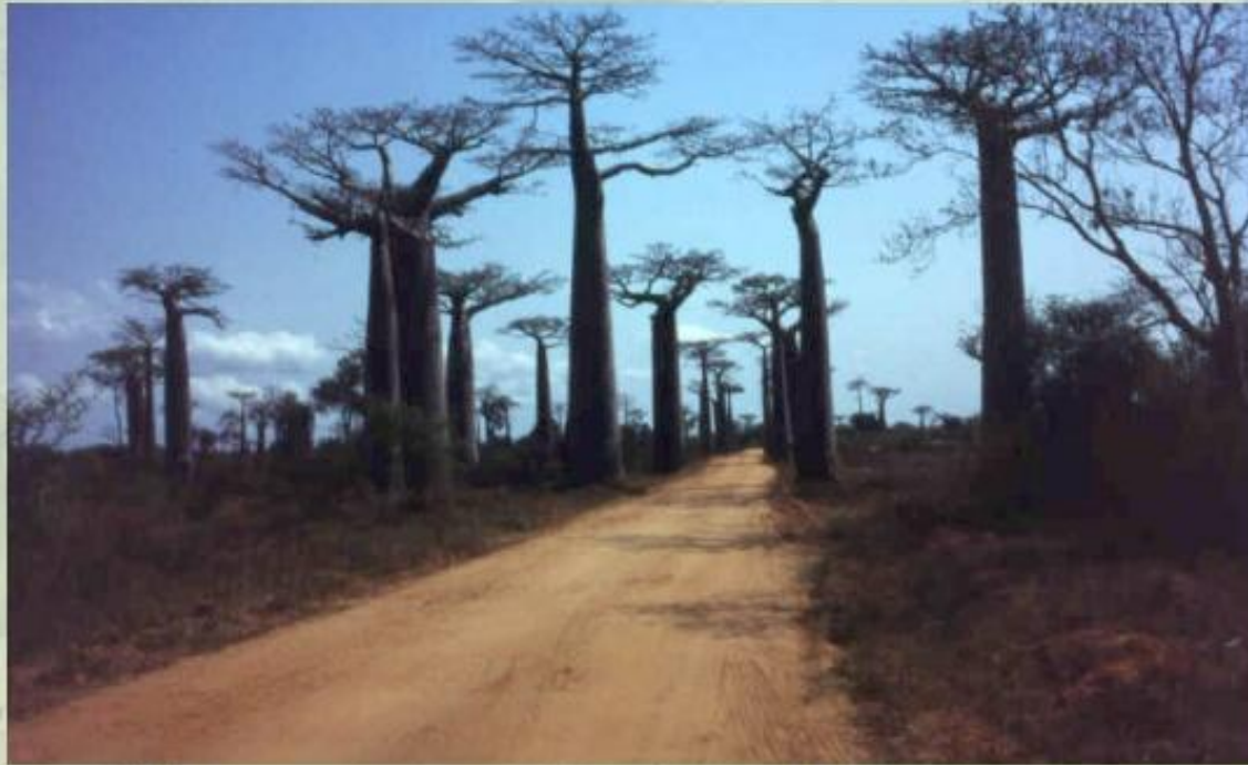
Аллея баобабов на острове Мадагаскар.

Уникальна природа острова Мадагаскар , где представлены африканские, азиатские, южноамериканские, австралийские виды растений и животных. Кроме того, здесь встречаются и виды- эндемики , обитающие только на этом острове.