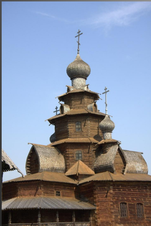
Музей деревянного зодчества