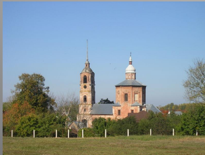
Церковь Бориса и Глеба