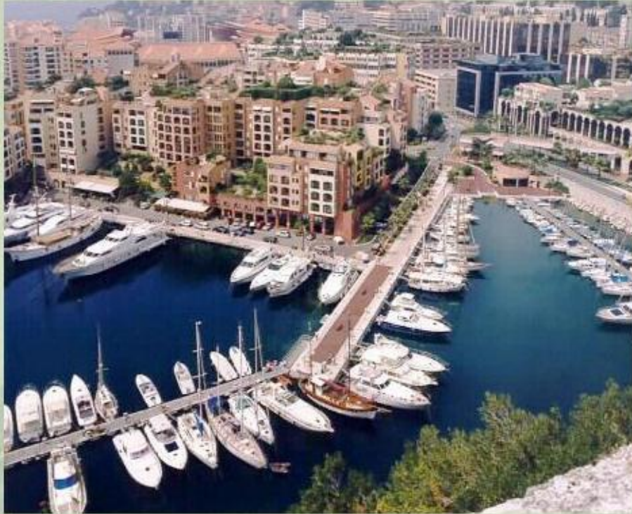
Гавань в Монако.