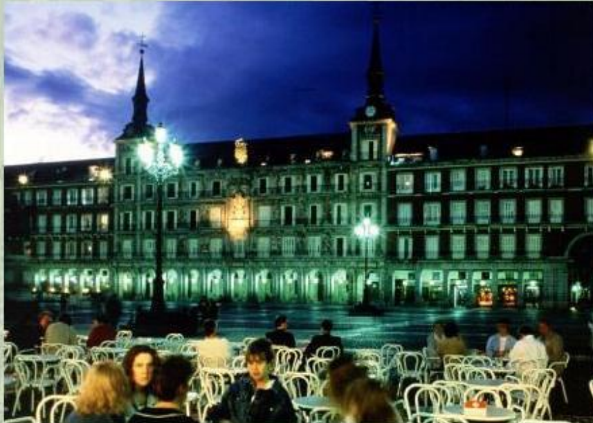
Мадрид - столица Испании.