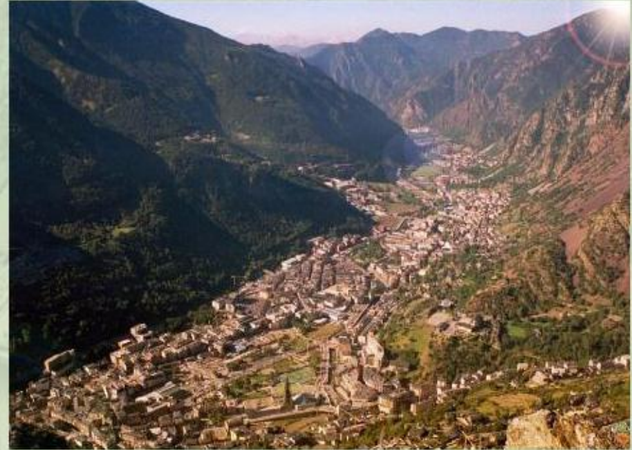
Андорра - небольшое государство в Пиренеях.