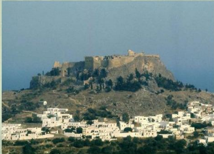
Греция - родина древних мифов.