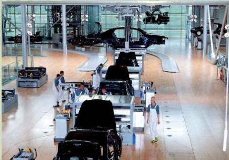
Сборочный цех «Мерседесов» на автомобильном заводе ФРГ.

Каменный уголь и железная руда - основа для развития черной металлургии, крупнейшие предприятия которой («Тиссен и Крупп») возникли еще в XIX веке.