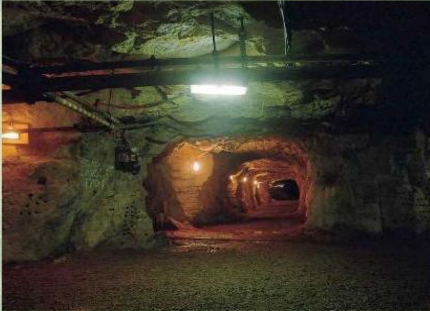
Шахта в Рурском угольном бассейне.