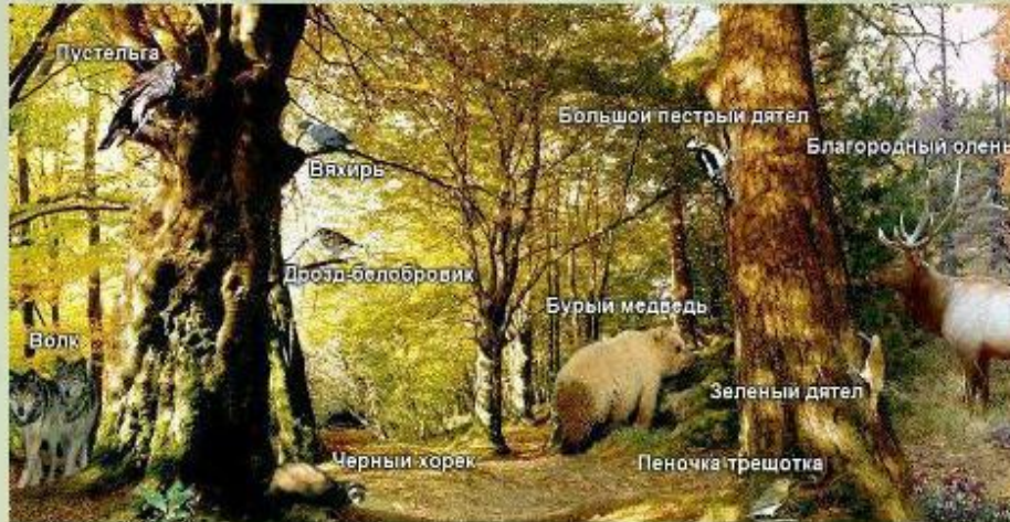
Животные широколиственных лесов Европы.

В прошлом густые широколиственные леса покрывали равнины. В течение длительного времени ландшафты равнин активно осваивались человеком и неузнаваемо изменились. На обширных пространствах на месте лесов появились города и сельские поселения, поля и сады, проложены автомагистрали и трубопроводы. Первичные леса сохранились небольшими массивами, которые называют пущами . Среди таких массивов - известный заповедник Беловежская Пуща, который расположен на территории Польши и Белоруссии. Здесь охраняют некогда широко распространенных в европейских лесах зубров и оленей, а также других животных.