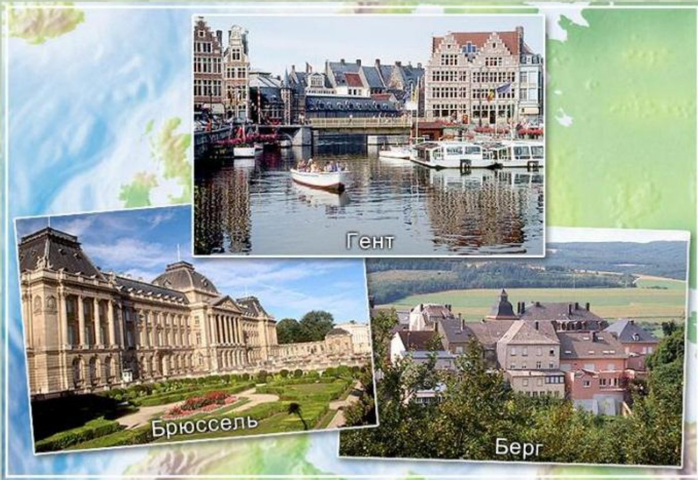
Города стран Бенилюкса (Бельгии, Нидерландов, Люксембурга).