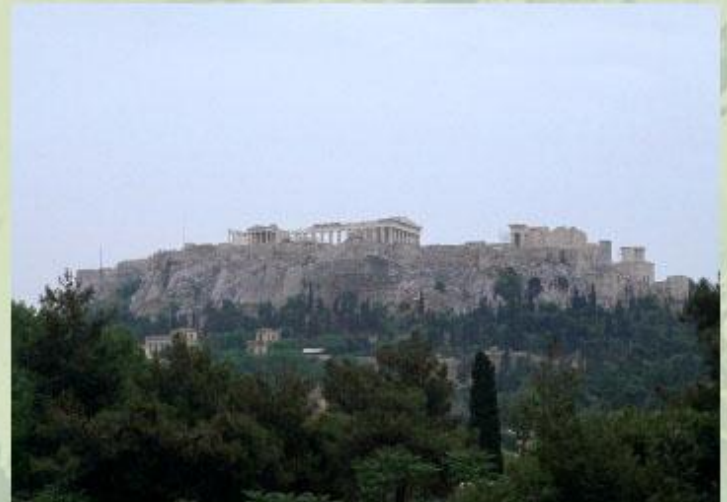
Афинский Акрополь - шедевр античной архитектуры.

Узнать об одном из древних «семи чудес света» - египетских пирамидах - вы сможете из статьи Египетские пирамиды .