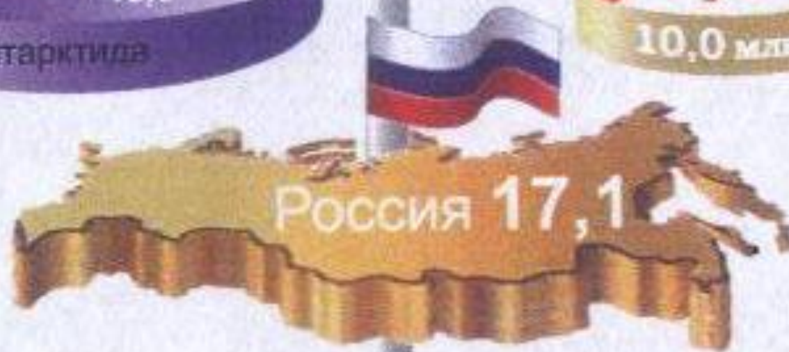
1.4. Площадь России в сравнении с площадью материков, частей света и крупнейших стран (в млн км²)