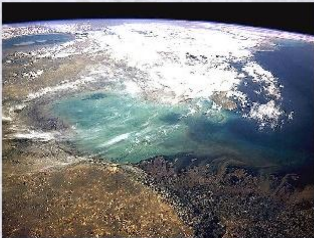
Дельта реки Волги (фотография со спутника).

Для решения сложных современных географических задач сегодня применяются геофизические и геохимические методы, аэрофотосъёмка местности. Появились математические и космические методы исследования (например, фотосъёмка из космоса, система глобального позиционирования GPS), географический прогноз. В последнее время возникло новое направление географической науки - геоинформатика .