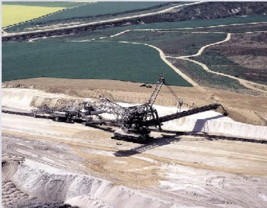
Работы по рекультивации земель на месте песчаного карьера.

Сохранение земельных ресурсов планеты - одна из важнейших задач, стоящих сегодня перед человечеством. Никакая синтезированная пища не заменит продуктов растительного происхождения, их белки и углеводы. С целью охраны почв нужно предпринимать следующие действия: приостановить потери естественного плодородия почвы, бороться с эрозией почв и развеиванием почв ветром, тщательно выбирать наиболее подходящие для данного типа почв сельскохозяйственные растения, повышать культуру земледелия. Особенно большое значение в современном мире приобретает рекультивация земель , то есть восстановление почвенного покрова после окончания горных и строительных работ.