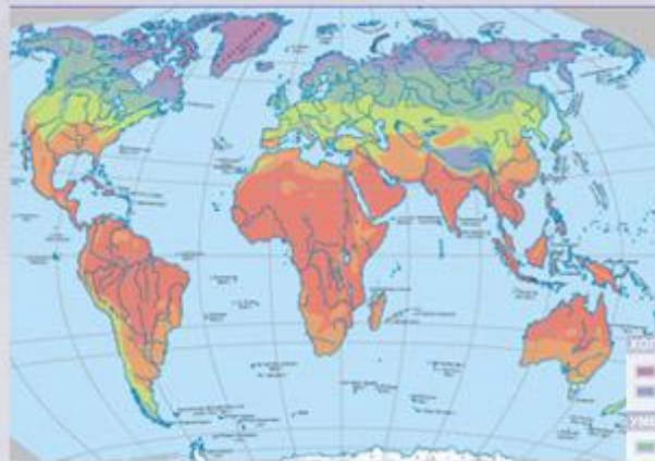
Агроклиматическая карта мира