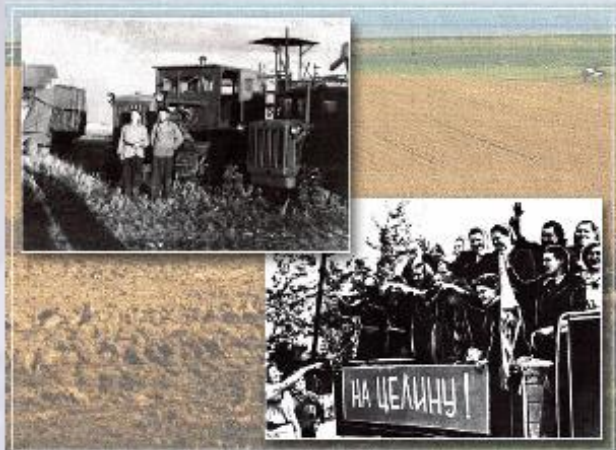
Освоение целины в СССР.