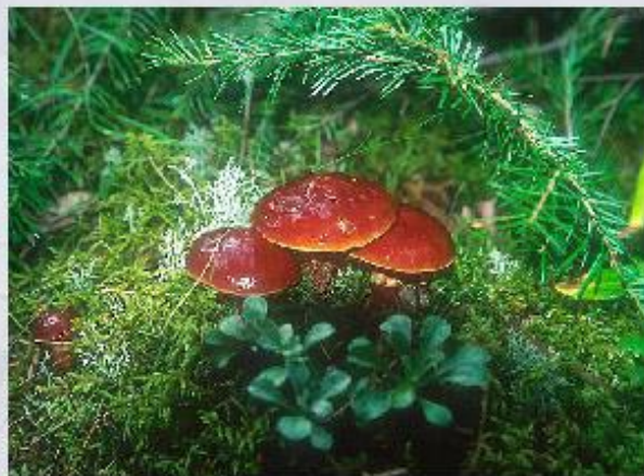
Биологические ресурсы лесов (брусника, маслята зернистые).

Биомассу Земли составляют растительные и животные организмы. Их совокупность образует биологические ресурсы .