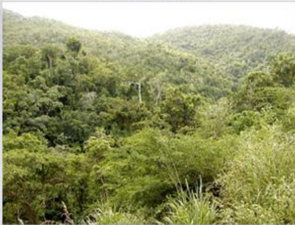
Влажный тропический лес.