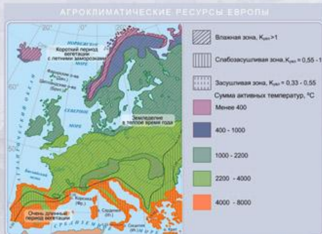
Агроклиматические ресурсы Зарубежной Европы.

Соотношение тепла и влаги, величина солнечной радиации и сезонность климатических изменений, влияющие на хозяйственную деятельность человека, называются агроклиматическими ресурсами . Географическое распределение этих ресурсов находит отражение на агроклиматической карте.