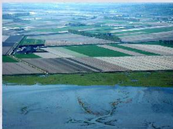
Польдеры — земли, отвоёванные у моря в Нидерландах.

Сокращение обрабатываемых земель происходит не во всех странах. Страны, обладающие большой территорией и значительными земельными ресурсами, часто осваивают целинные земли, то есть ту часть земельного фонда, которая ранее не использовалась в сельскохозяйственном производстве. Государственная политика освоения целинных земель проводилась в Советском Союзе в конце 50-х - начале 60-х годов прошлого века. К сожалению, эта кампания в нашей стране привела к деградации ранее плодородных земель.