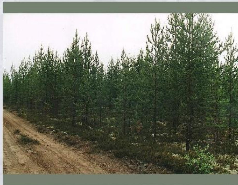
Лесопосадки на месте вырубленных лесов.

Как следует наиболее правильно и полно использовать ресурсы? Какие меры требуется принимать для их скорейшего восстановления и воспроизводства? Изучением этих вопросов занимается комплексная научная область знаний - природопользование . Использование природных ресурсов человеком может быть рациональным и нерациональным .