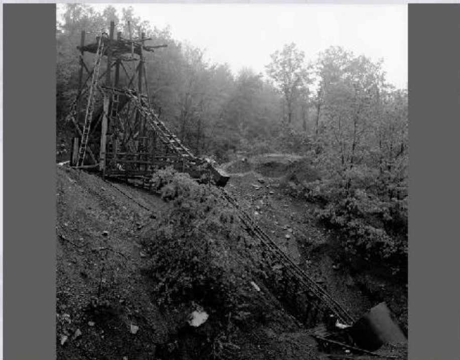
Нерациональное природопользование. Заброшенная шахта.