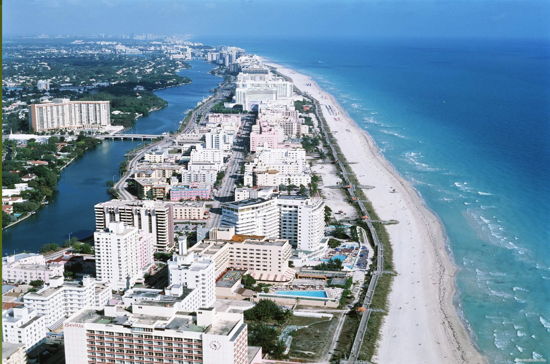
Майами-Бич – атлантический курорт