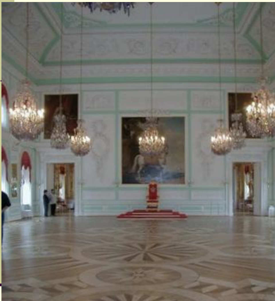
Тронный зал (самый большой (330 кв. м.) и наиболее торжественный зал дворца )