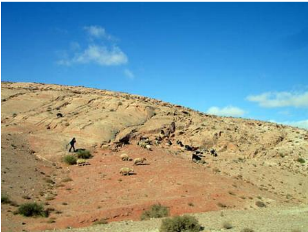
Пустыня Вади Рам