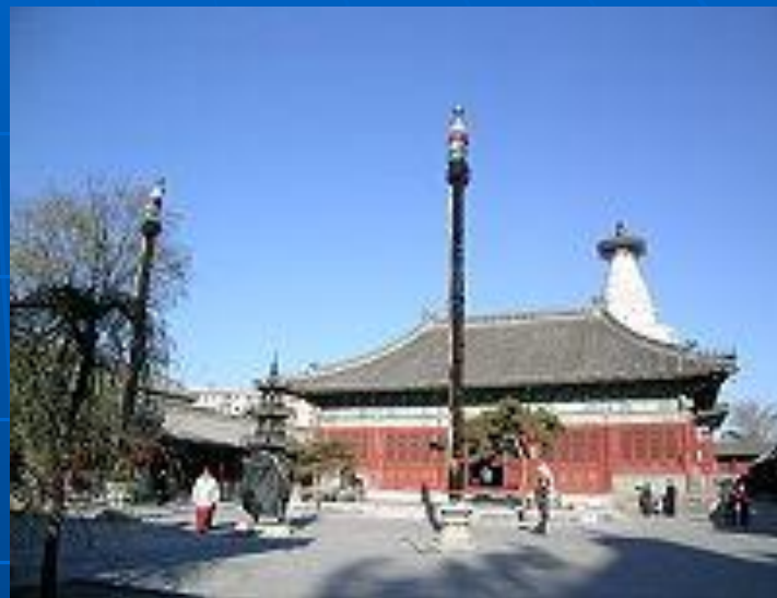
Храм Мяоин — один из самых известных буддистских храмов Пекина.