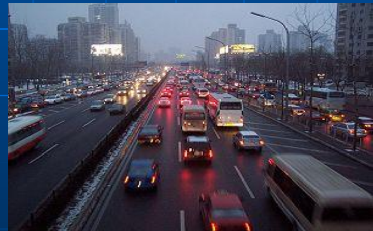
Пробка в Пекине.

Велосипед - это излюбленное средство передвижения пекинцев. В Пекине очень ровные дороги, поэтому ездить на велосипеде очень удобно. Некоторые мастерские и гостиницы дают велосипеды напрокат.