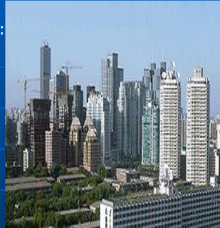
Растущий Центральный деловой район.