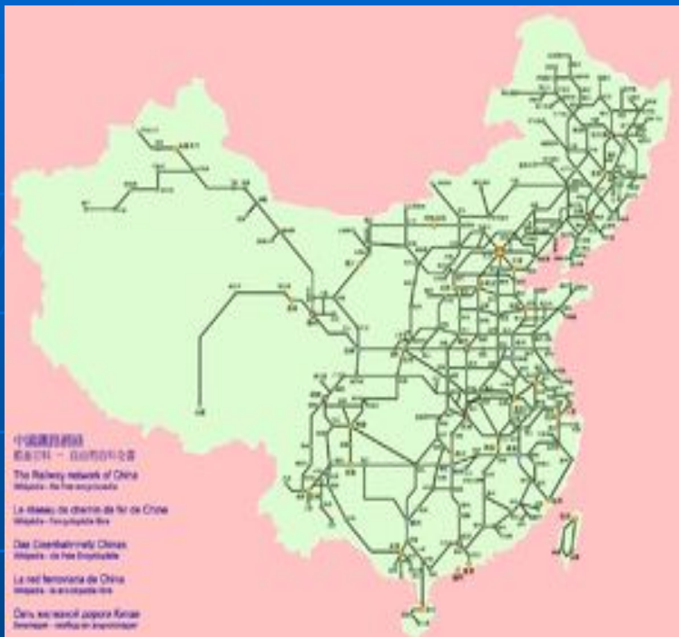
Карта дорог Китая

Такси. В Пекине великое множество такси. Такси можно поймать в любое время суток. Деньги за проезд платятся по счетчику. Цена за километр в зависимости от класса такси колеблется от 1,40 юаня до 2,50 юаня (наклейка с ценой за 1 км. прикреплена к боковому стеклу автомобиля). Начальная цена на счетчике - это плата за первые 4 километра пути.