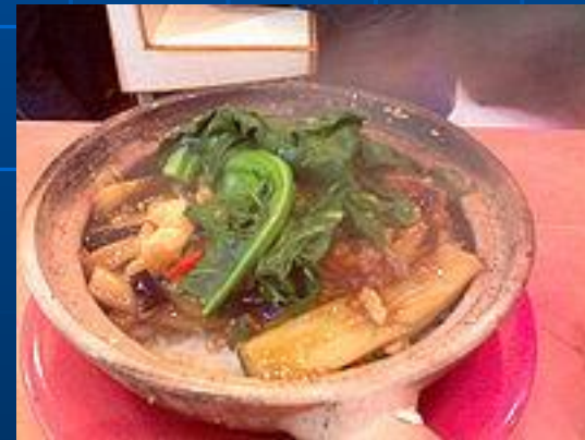
Блюдо кантонской кухни из риса с гарниром