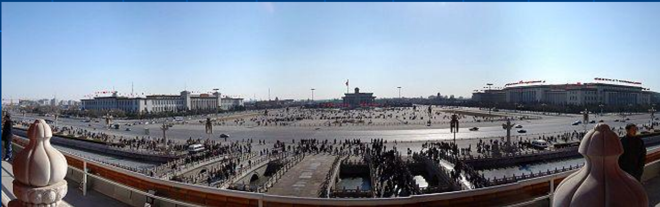
Вид на площадь Тяньаньмэнь с Ворот Небесного Спокойствия