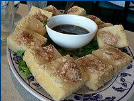
Блюдо кантонской кухни из жареного тофу Блюдо кантонской кухни из жареного тофу с креветками

Деликатесы китайской кухни известны во всём мире – утка по-пекински, жареные майские жуки, креветки, разнообразные блюда из овощей, черепаховый суп, жареные щупальца осьминогов и т. д. К пище в Китае отношение особое – это не просто средство утоления голода, но и способ предохранить себя от различных заболеваний. Китайцы уверены, что каждый ингредиент блюда представляет одну из двух основоположных и противоборствующих сил – инь и ян. Блюда, которым присущ элемент инь (например, зелёный чай), считаются холодными, такими, что охлаждают тело. А блюдам, наделённым элементом ян (собачий суп), свойственно горячее начало.