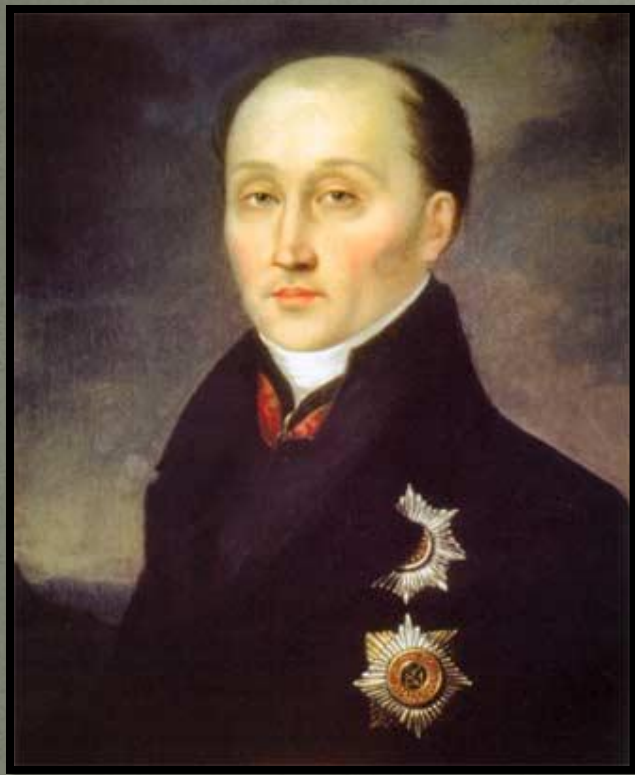
Михаил Михайлович Сперанский