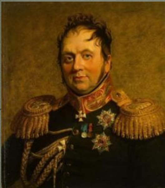
Шведский барон Густав Армфельд

Сговорившись между собой, участники интриги стали с некоторых пор регулярно сообщать государю разные дерзкие отзывы, исходящие из уст его госсекретаря. Но Александр не стремился прислушиваться, так как в отношениях с Францией были проблемы, а предостережения Сперанского о неизбежности войны, его настойчивые призывы готовиться к ней, конкретные и разумные советы не давали оснований для сомнений в преданности его России. В день своего 40-летия Сперанский был удостоен орденом Александра Невского. Однако ритуал вручения прошёл непривычно строго, и стало ясно, что «звезда» реформатора начинает тускнеть. Недоброжелатели (среди которых был Шведский барон Густав Армфельд, председатель комитета по делам Финляндии, и А. Д. Балашов, руководитель Министерства полиции.) Сперанского ещё больше активизировались. Они передавали Александру все сплетни и слухи о госсекретаре. Но возможно, эти отчаянные доносы в конечном счёте не возымели бы сильного действия на императора, если б весной 1811 г лагерь противников реформ не получил вдруг идейно-теоретического подкрепления. В Твери вокруг сестры Александра Екатерины Павловны сложился кружок людей недовольных либерализмом государя и в особенности деятельностью Сперанского.