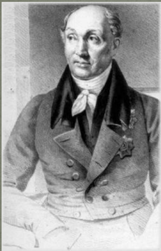
Михаил Михайлович Сперанский

В Александро-Невскую семинарию направлялись лучшие слушатели провинциальных семинарий со всей России. В их число удостоился чести попасть и Михаил Михайлович Сперанский, по направлению прибывший в столицу. Свободно овладев французским, он увлекся просветительской философией, что наложило несмываемый отпечаток на него в будущем. Выдающийся ум и независимость суждений проявляются в ученических проповедях Сперанского. Лучшему студенту (как и во Владимире — Сперанскому) священноначалие доверило произносить проповеди. 8 октября 1791 года он произнёс в Александро-Невской лавре необычайно смелое наставление в присутствии знаменитого митрополита Гавриила. Речь его содержала обращение к государю с предостережением и рассказывала об «истинном и ложном просвещении». Свои свободные часы, в отличие от большинства своих товарищей, Сперанский предпочитал проводить не в доступных развлечениях, а в чтении имеющихся книг. Это время в его жизни было периодом интенсивных движений ума, и окончательного духовного созревания. Все это позволило Сперанскому стать одним из наиболее эрудированных семинаристов.