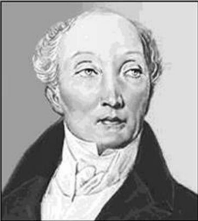
Михаил Михайлович Сперанский

Реформы, проводимые Сперанским, затронули практически все слои российского общества. Это вызвало бурю недовольных возгласов со стороны дворянства и чиновничества, чьи интересы были затронуты более всего. Всё это отрицательно сказалось на положении самого государственного советника. Просьбу об отставке в феврале 1811 г. Александр I не удовлетворил, и Сперанский продолжил работу. Но дальнейшее течение дел и времени приносило ему все новых и новых недоброжелателей. В последнем случае Михаилу Михайловичу припомнили Эрфурт и встречи с Наполеоном. Этот упрек в условиях обострившихся российско-французских отношений было особенно тяжелым. Интрига всегда играет большую роль там, где существует режим личной власти. К самолюбию прибавлялась в Александре чрезвычайная боязнь насмешки над собой. Если кто-либо засмеется его присутствию, на него посматривая, Александр тут же начинал думать, что это над ним смеются. В случае со Сперанским противники реформ выполнили такую задачу блестяще.