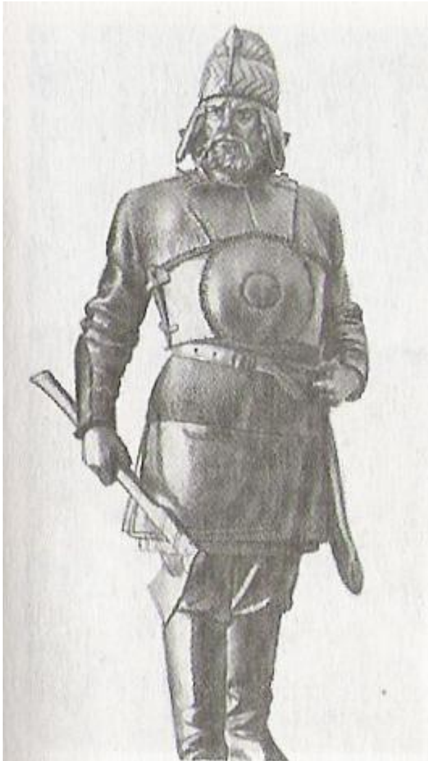
Скульптура Ермак. Скульптор М.М. Антокольский