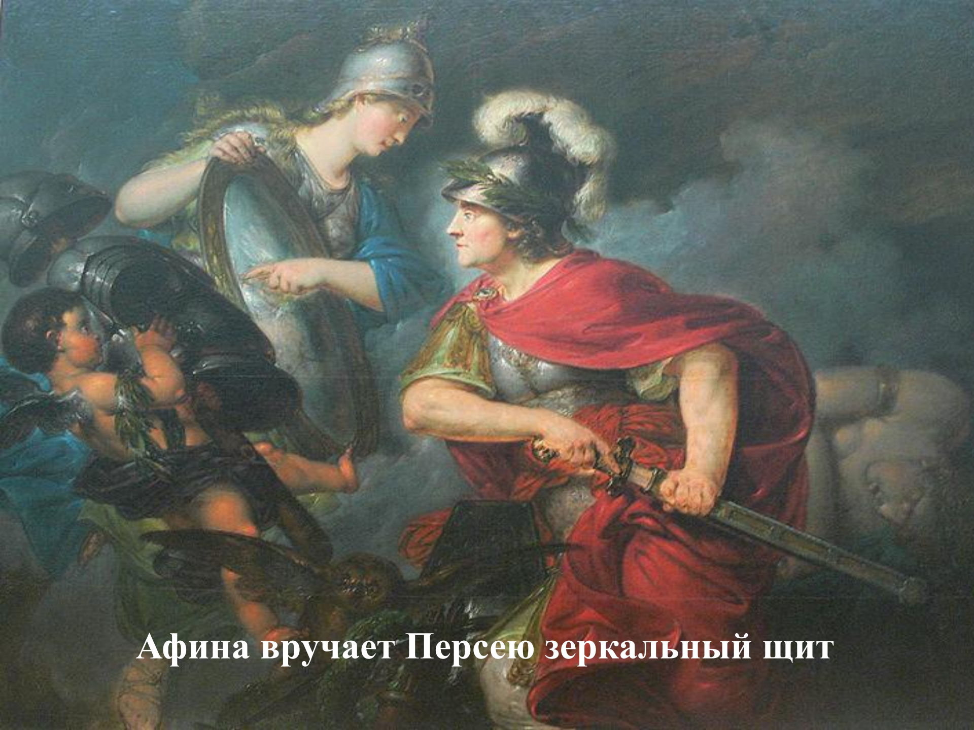
Афина вручает Персею зеркальный щит