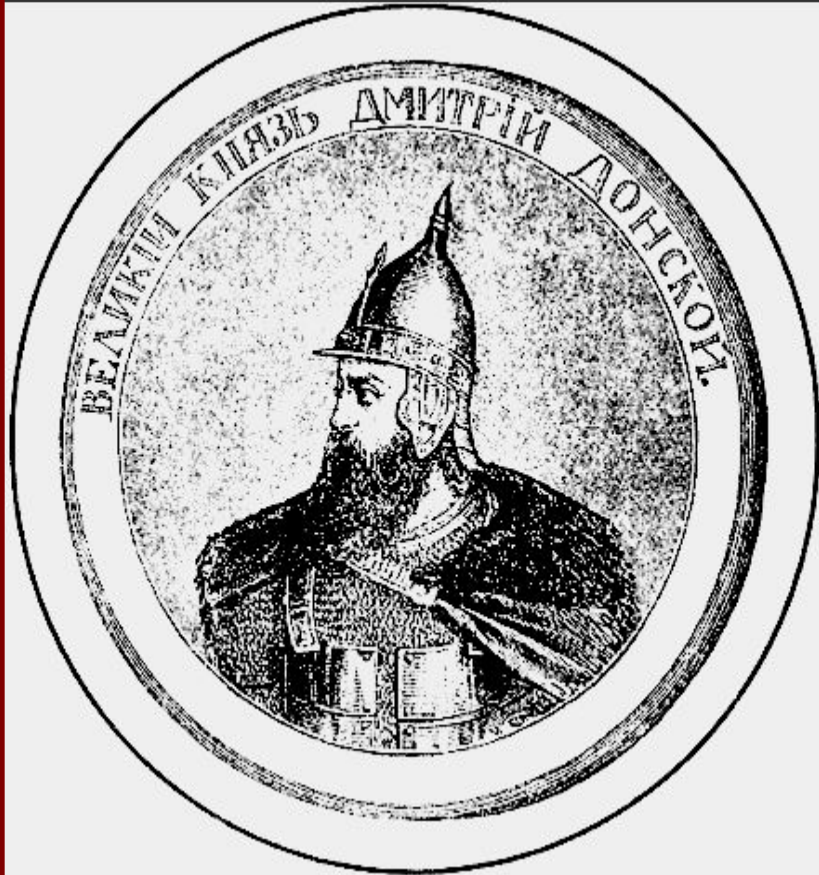
Великий князь Дмитрий. Гравюра XIX в.

В 1375 г. Дмитрий подошел к Твери и тверской князь признал себя «Молодшим братом».