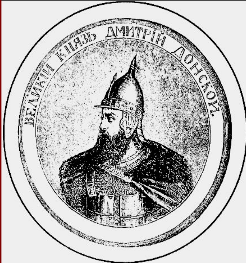
Великий князь Дмитрий. Гравюра XIX в.

В 1375 г. Дмитрий подошел к Твери и тверской князь признал себя «Молодшим братом».