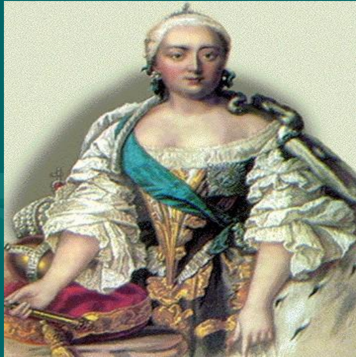
• Елизавета Петровна

В 1742 Петр был привезен в Россию и своей тетей императрицей Елизаветой Петровной провозглашен наследником престола.