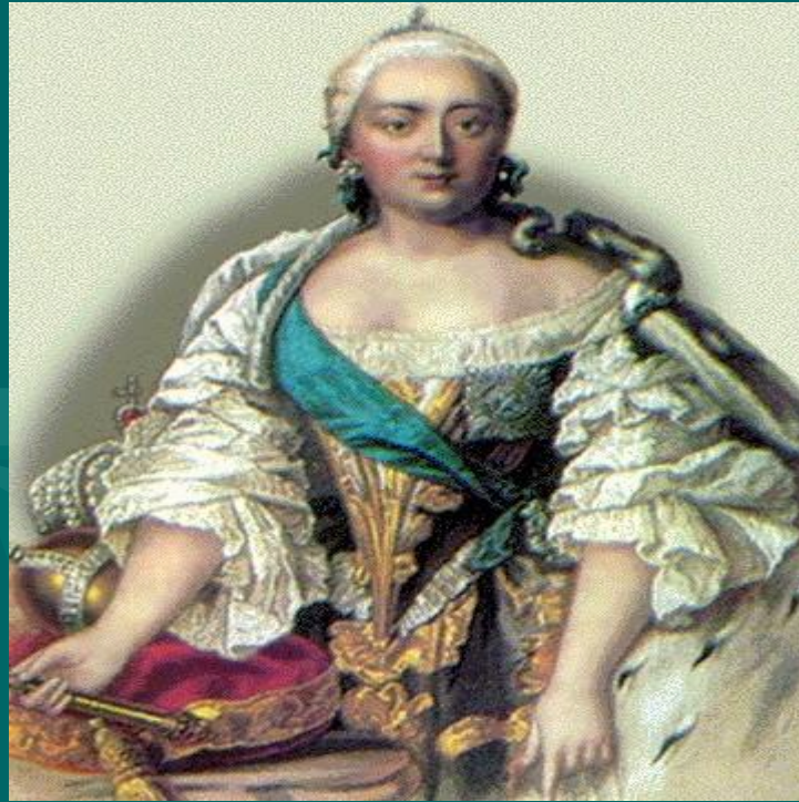
• Елизавета Петровна

В 1742 Петр был привезен в Россию и своей тетей императрицей Елизаветой Петровной провозглашен наследником престола.