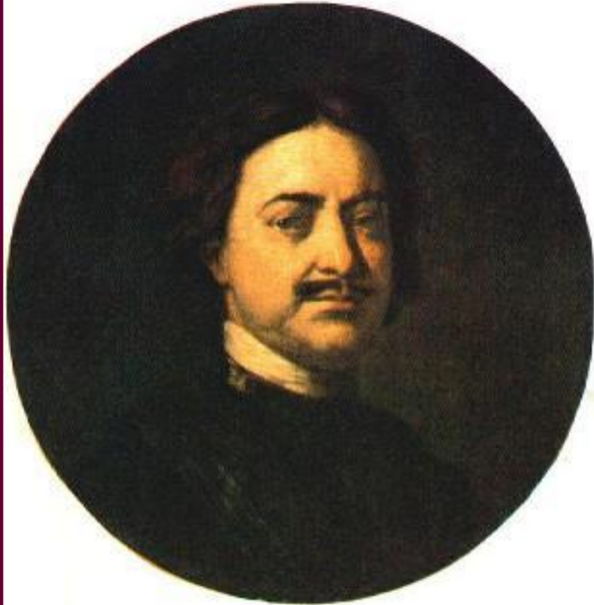
И. Никитин Портрет Петра I.

В н.18 в. художественная культура приобрела светский характер и получила поддержку государства.