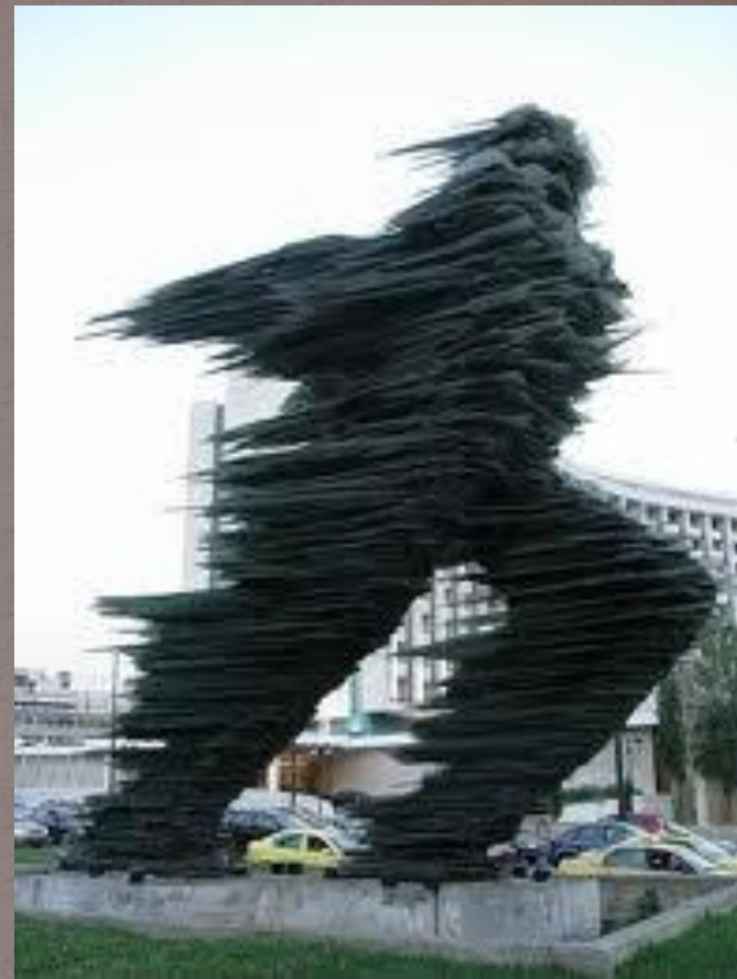
Статуя в г. Афины

Постепенно, из-за скудных условий жизни, количество населения города начало сокращаться. Также подверглись уничтожению здания и памятники культуры.