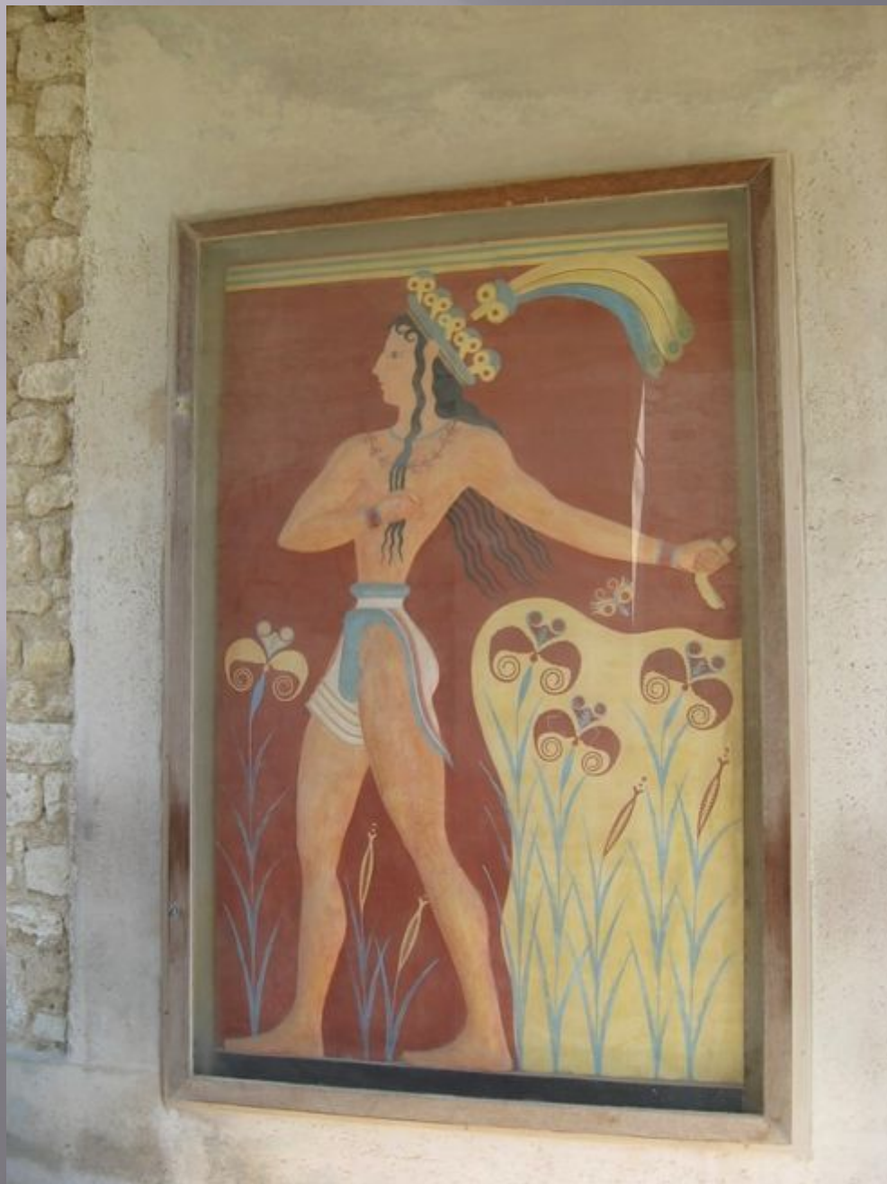
Юноша. Фреска на стене дворца.