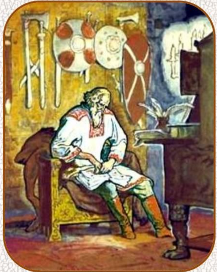
Великий князь Владимир Мономах.

Владимир Мономах оставил замечательное произведение: «Поучение чадам своим». Текст «Поучения» обнаружен в Лаврентьевской летописи, которая, как вы помните, написана в 1377 году. В каком году Владимир писал свое «Поучение», точно неизвестно. Может быть, вскоре после съезда князей в Любече? И поэтому так горячо призывает князь русских людей к единству и бескорыстному служению