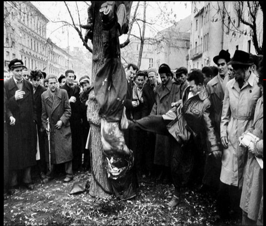
Повешенный вниз головой изуродованный труп сотрудника ГБ