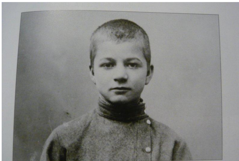
Андрей Климентов. Около 1909

Андрей Платонович Климентов, которого читатель знает под фамилией Платонов, родился 28 (16) августа 1899 года.