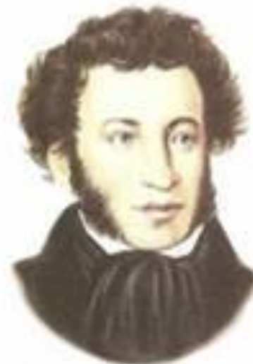
Одоевский Пётр Алексеевич (1799-1837)