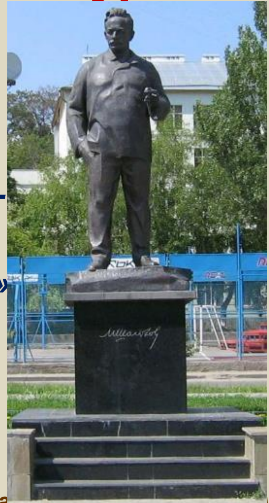
Памятник Михаилу Шолохову на набережной реки Дон в городе Ростове-на-Дону