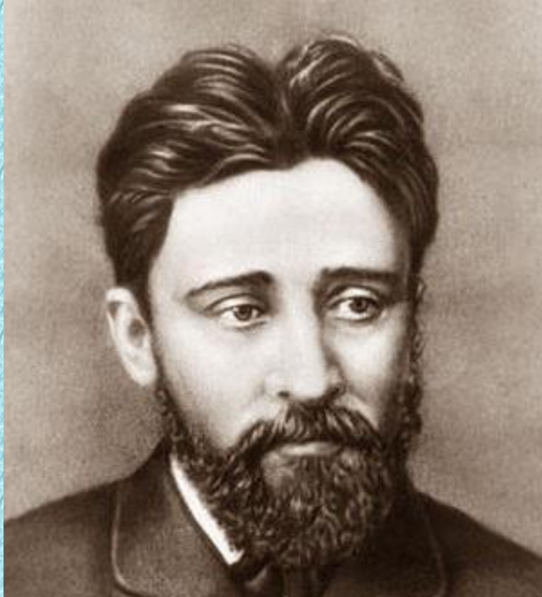
Гаршин Всеволод Михайлович