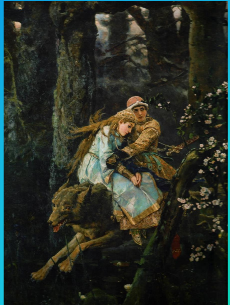
«Иван Царевич на сером волке»