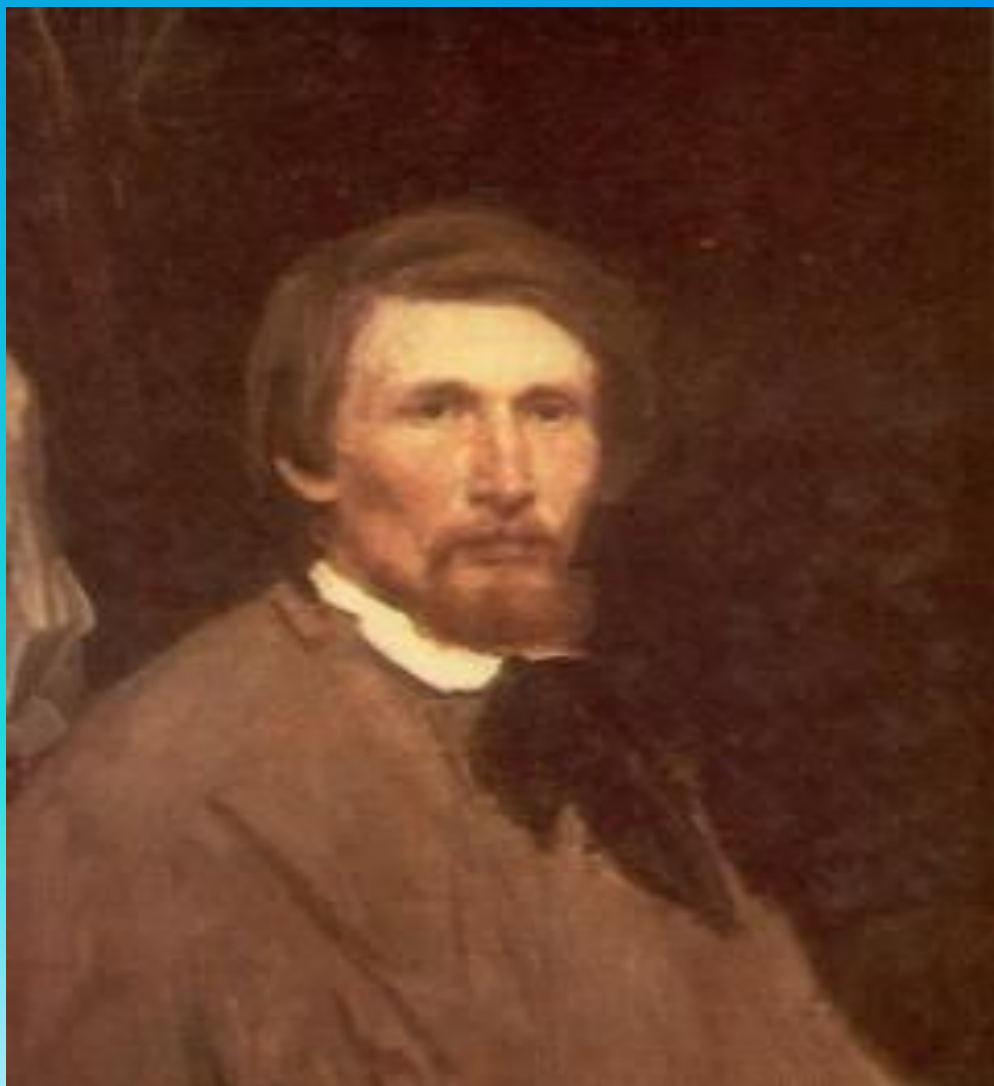
Виктор Михайлович Васнецов (1848-1926)