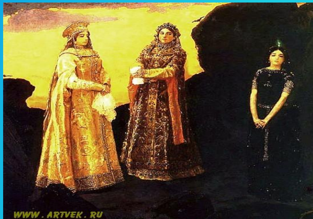
«Три царевны Тёмного царства»