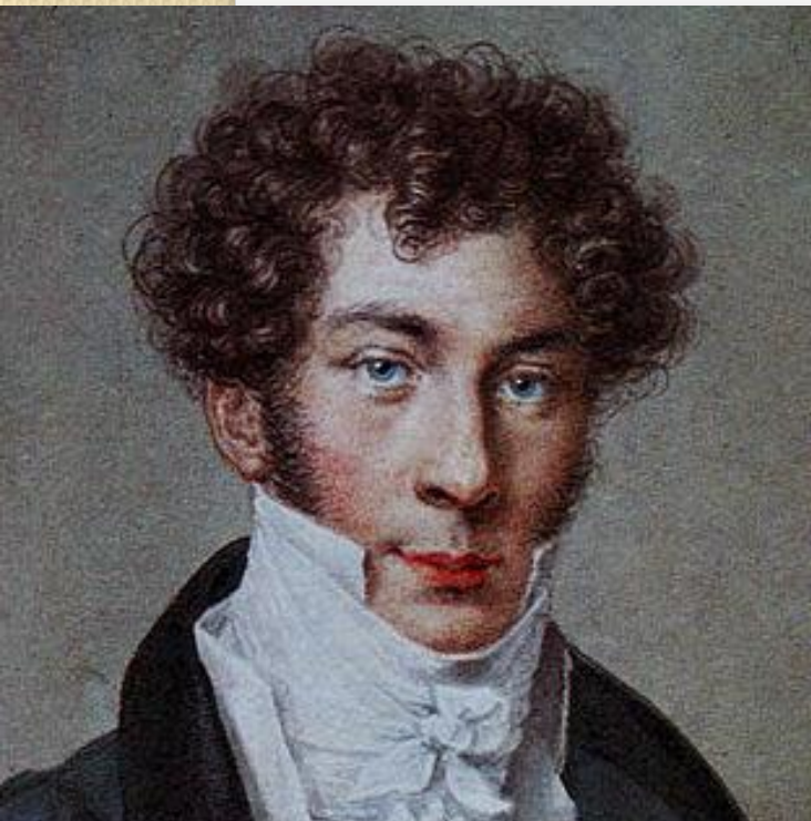
Батюшков Константин Николаевич (1787-1855)

В начале столетия началась поэтическая деятельность В.А. Жуковского. Его первые стихотворения обратили на себя внимание тонкостью чувства и "сладостью стиха". Его имя стало знаменитым, когда в двенадцатом году был написан "Певец во стане русских воинов", исполненный патриотическим одушевлением. Современники не замечали странности формы, где русские воины являлись в классических вооружениях и в романтическом освещении: классическая условность еще не была забыта, к романтической начинали привыкать. Его поэзии отвечал личный характер, религиозно-мистическое настроение сближало его с Гоголем. От новейшего литературного круга он был далек. В ходе литературного развития Жуковский кроме переводных трудов, всегда изящных и расширявших горизонт русской поэзии, имел еще заслугу высокого понимания существа поэзии. Его определение поэзии отвечало всему его мировоззрению. Поэзия - "есть Бог в святых мечтах земли", и с другой стороны, "поэзия - есть добродетель". Определение было слишком личное, но во всяком случае, ставившее поэзию в самые высокие сферы нравственной жизни.