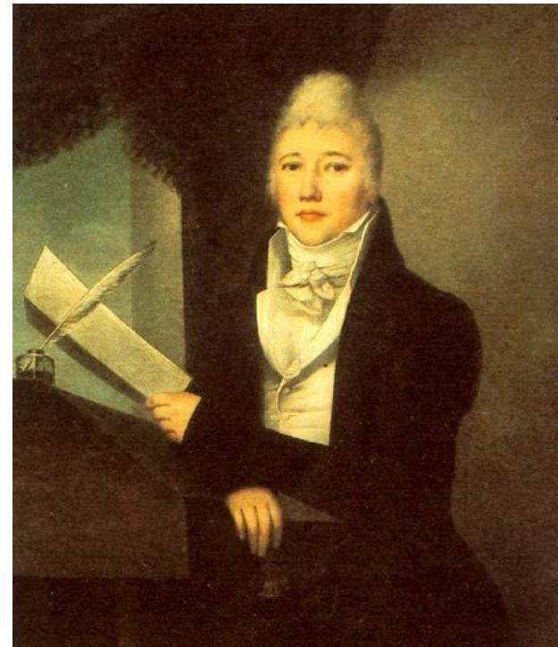
Озеров Владислав Александрович (1770 - 1816)

Другим весьма известным и почитаемым писателем того времени был Н.И. Гнедич, главнейшим трудом которого был перевод Илиады: он положил многие годы на завершение этого труда, возбудившего удивление современников. В переводе Гнедича видна серьезная работа над Гомером, но по старому пристрастию к ложно-классической высокопарности Гнедич уделил слишком много места церковнославянским элементам языка, употребляя иногда слова совсем неизвестные в обычной речи. В области драмы в начале столетия прославленным именем был В.А. Озеров : его трагедии были написаны в классическом духе, с большой легкостью стиха и искренностью чувства. Трагедии Озерова имели громадный успех, особенно "Дмитрий Донской", вызвавший патриотическое одушевление.