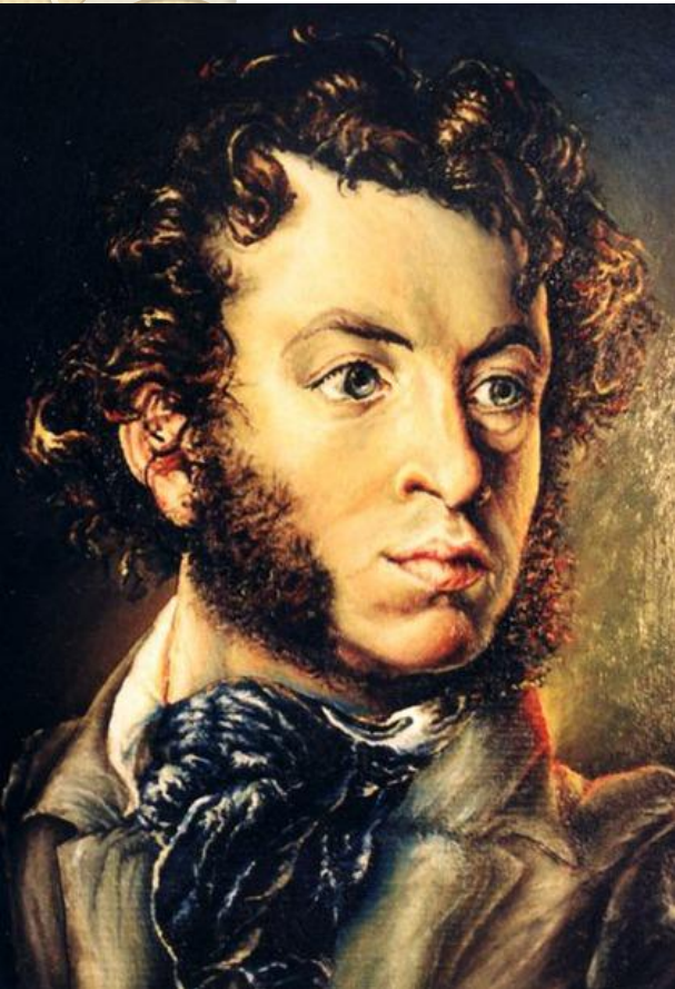
Пушкин Александр Сергеевич (1799-1837)

19 век называют «Золотым веком» русской поэзии и веком русской литературы в мировом масштабе. Не стоит забывать, что литературный скачок, осуществившийся в 19 веке, был подготовлен всем ходом литературного процесса 17-18 веков.