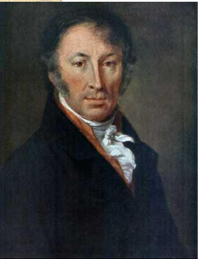
Карамзин Николай Михайлович (1766-1826)

В начале 19 века один из самых крупных деятелей литературы был Н.М. Карамзин . По природе склонный к чувствительности и меланхолии, он жадно воспринимал влияния западной литературы - Руссо и его последователей, французских и немецких, английского романа Ричардсона, юмора Стерна. Карамзин считал долгом посещать знаменитых писателей, и в первый раз в русской литературе давал живые сведения о действующих лицах европейского просвещения.