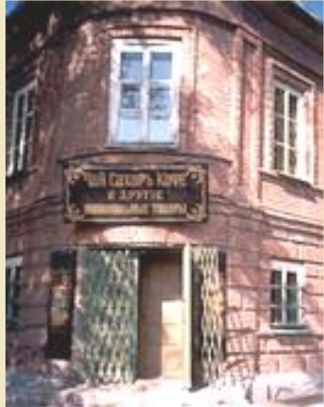
Лавка отца Чехова «Чай, сахар, кофе и другие колониальные товары»

В детстве Антон с раннего утра до позднего вечера работал в лавке.