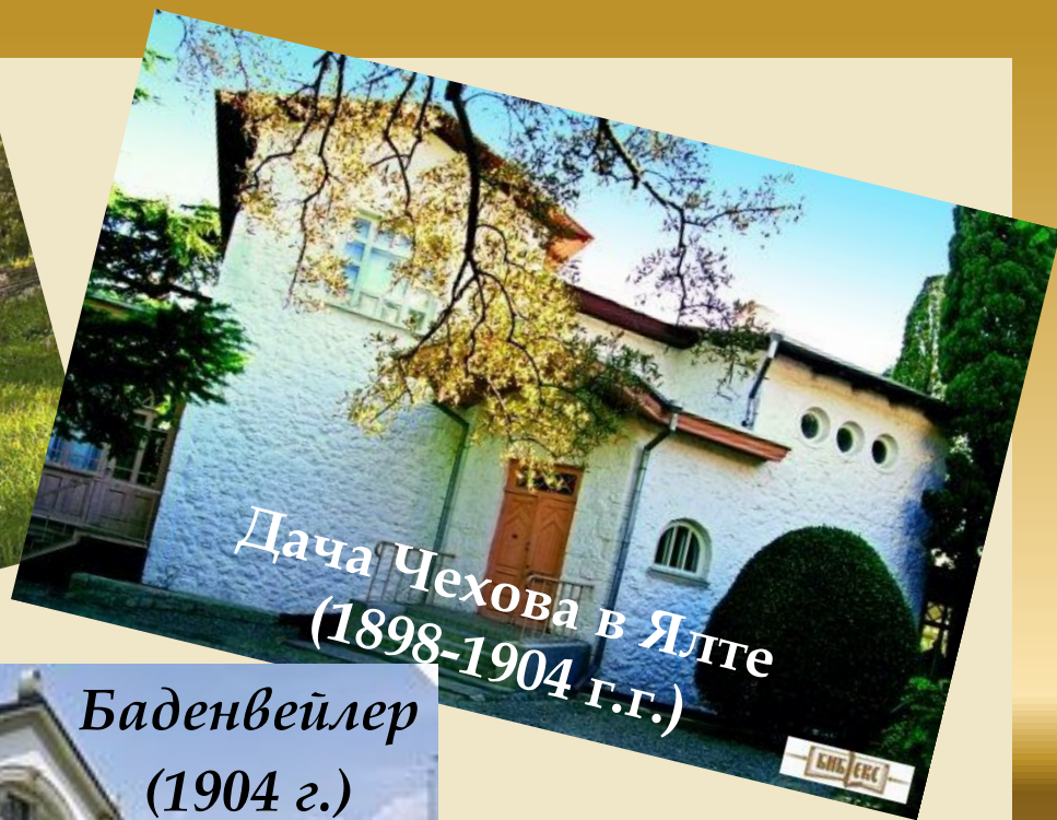
Дача Чехова в Ялте (1898-1904 г.г.)