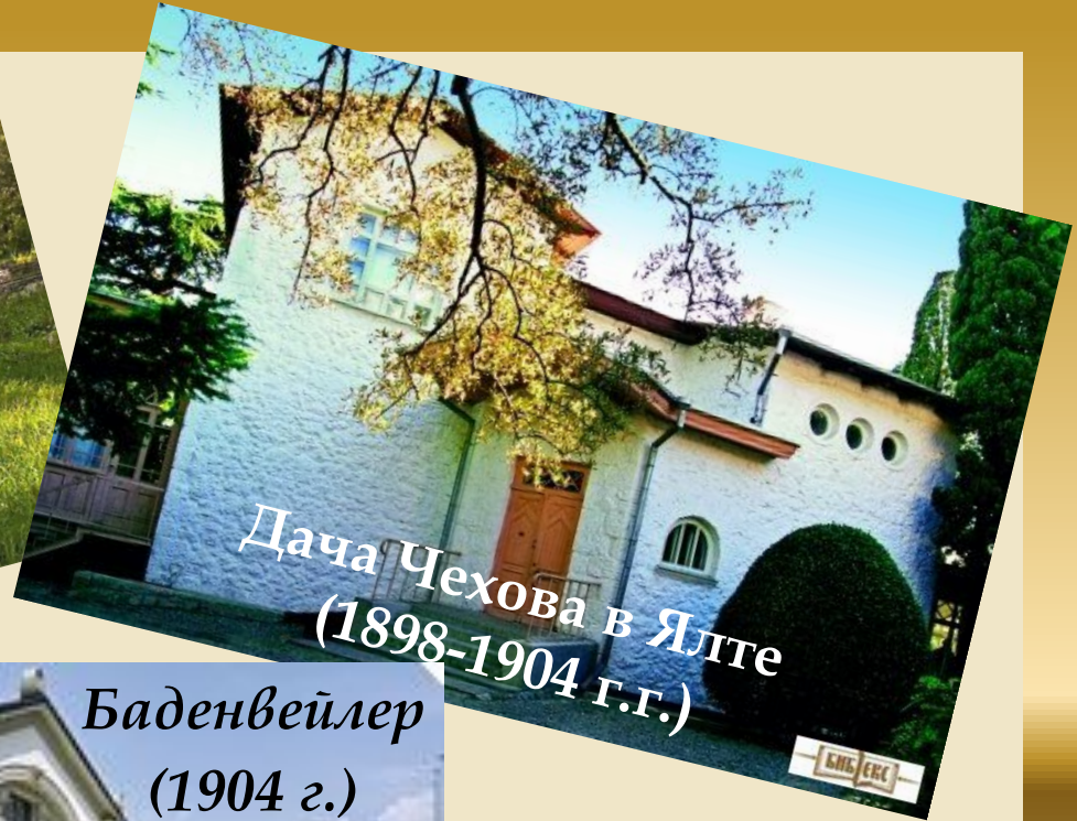
Дача Чехова в Ялте (1898-1904 г.г.)