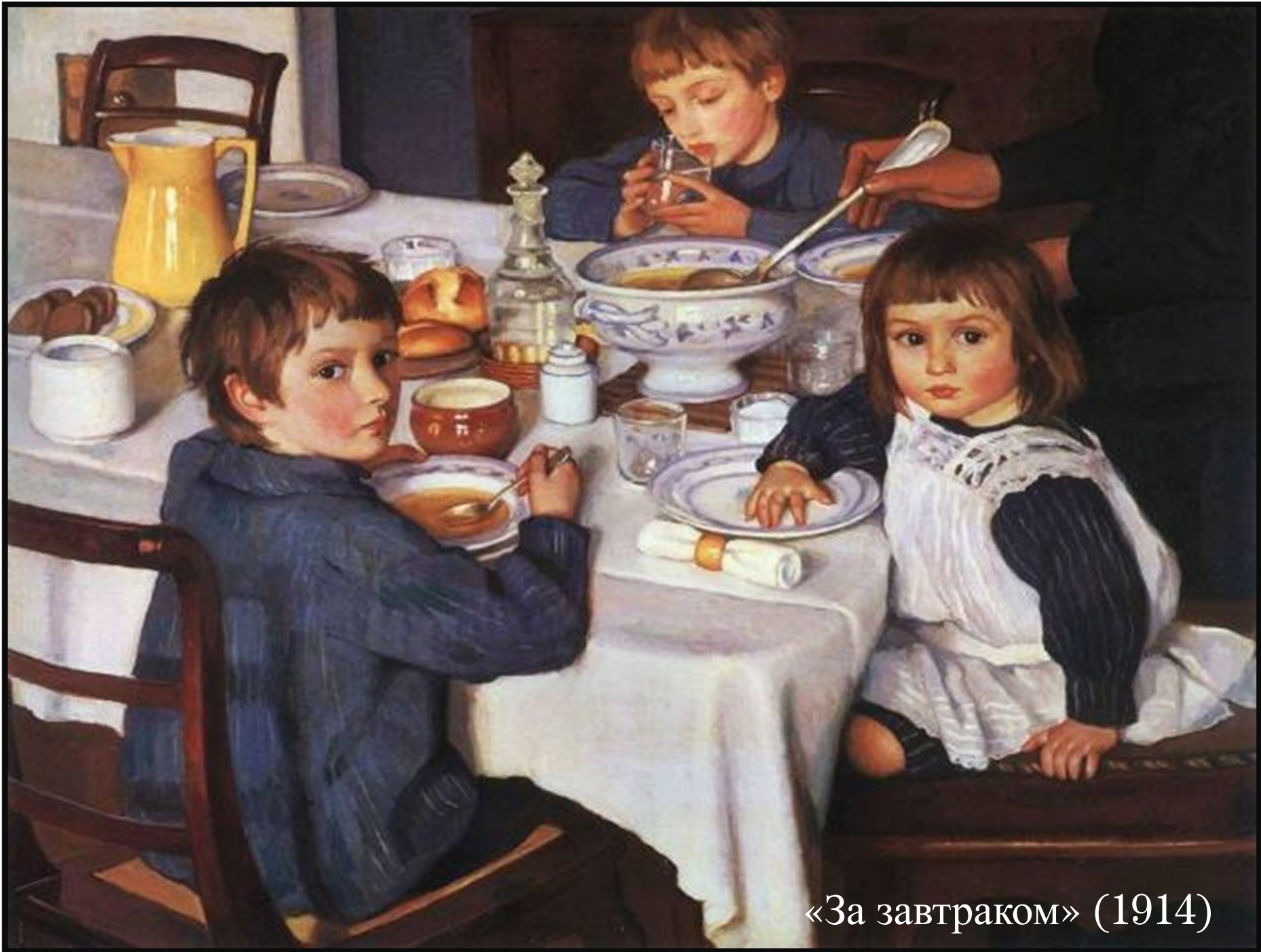
«За завтраком» (1914)