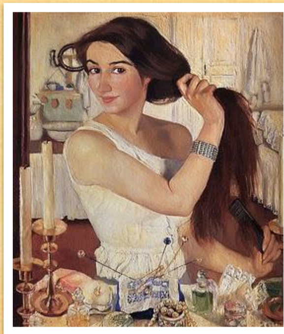
Автопортрет («За туалетом»)