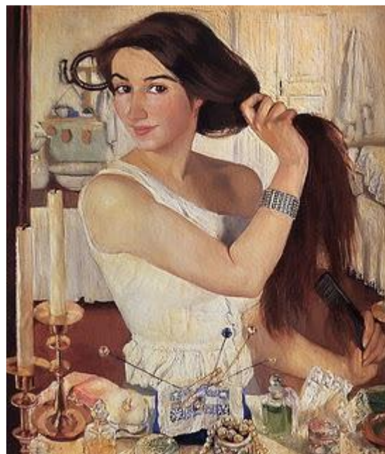
Автопортрет («За туалетом»)