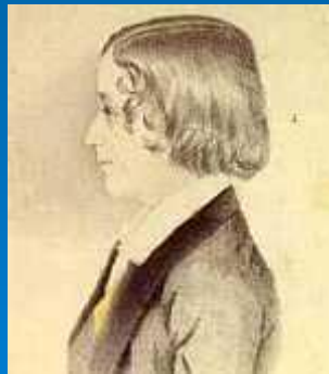
Старший сын, Александр Александрович Пушкин (1833-1914 г.)