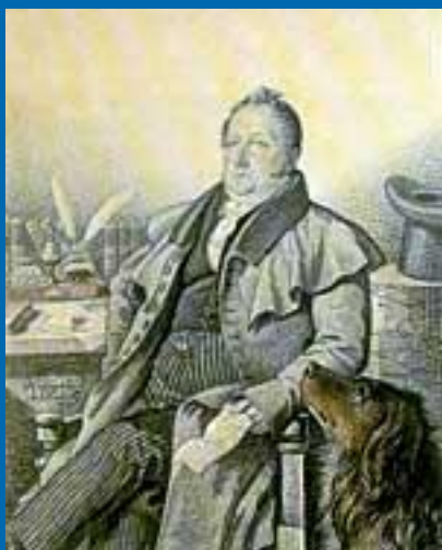
□ Отец, Сергей Львович Пушкин (1770-1838г. )