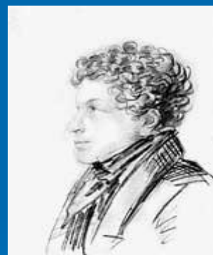
Брат, Лев Сергеевич Пушкин (1805-1852г.)