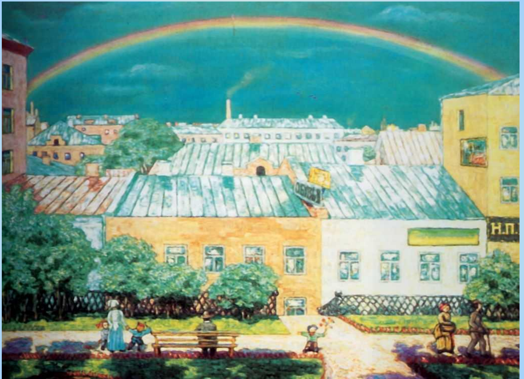
Московский пейзаж. Радуга. 1908