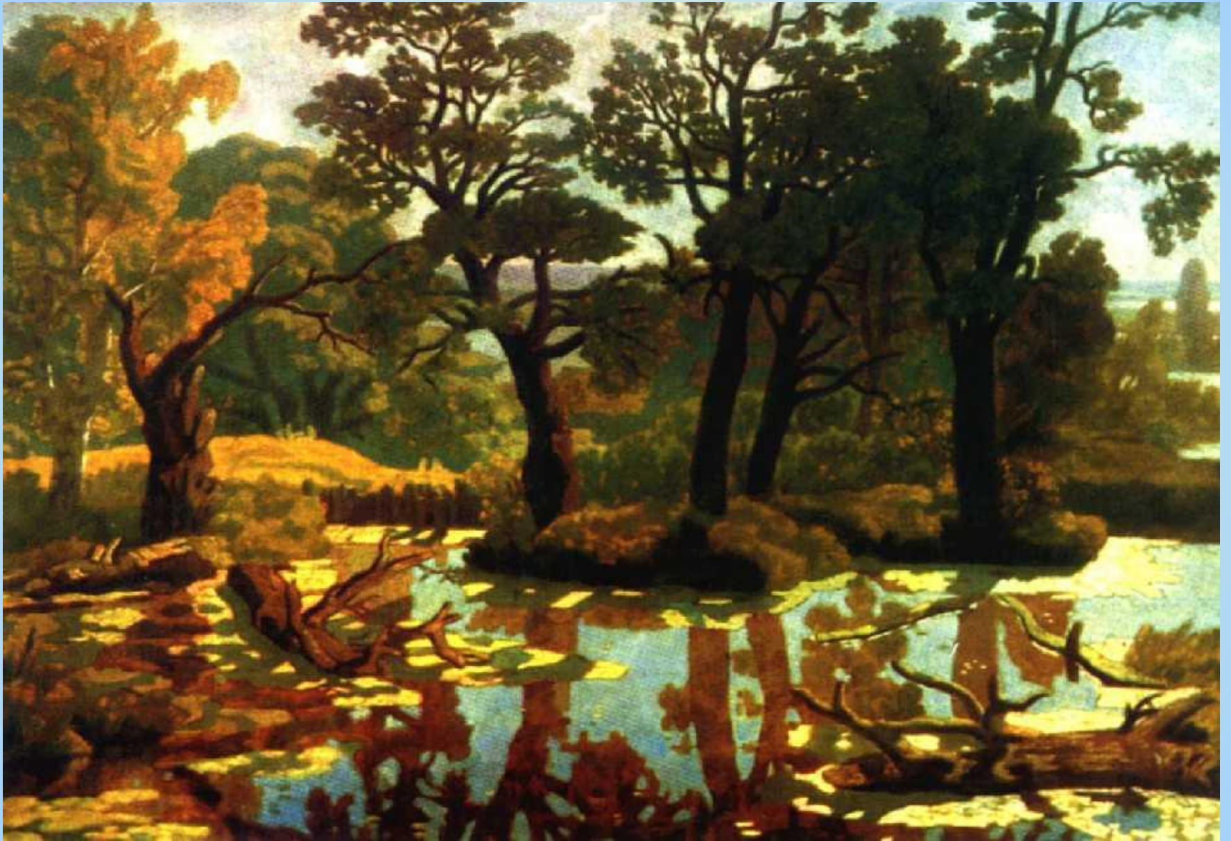
Пейзаж с рекой