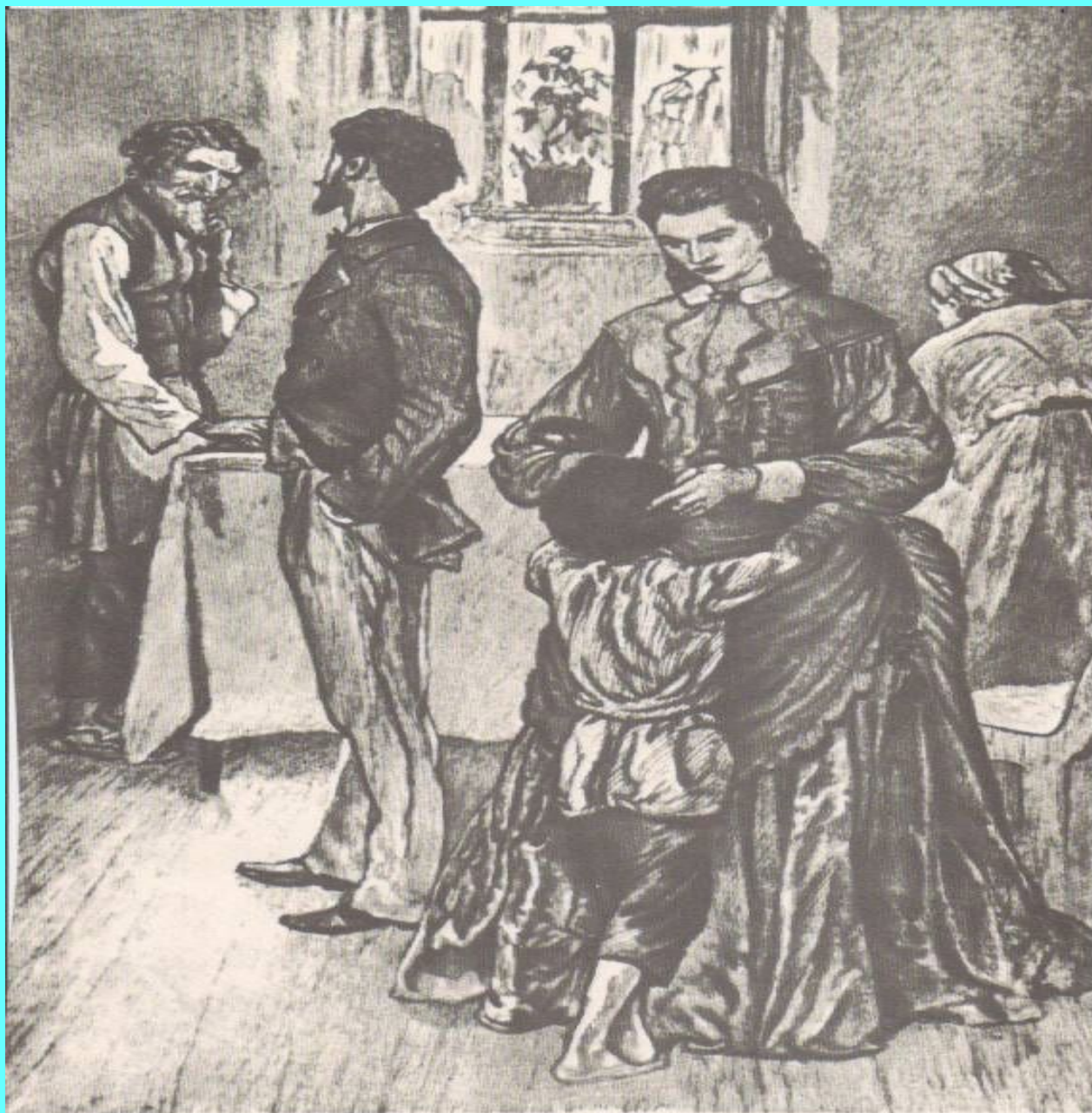
49. Алеша с матерью