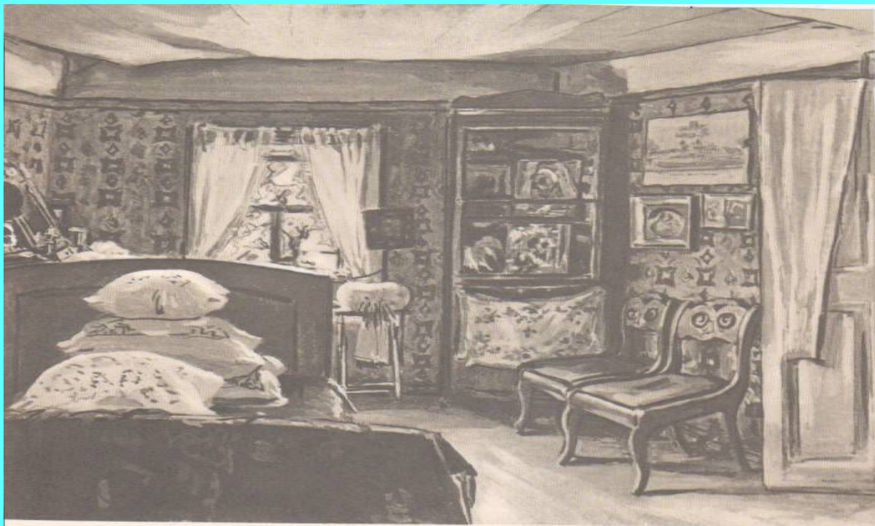
Дом В. В. Каширина (комната бабушки) Бытовой музей детства А. М. Горького в городе Горьком