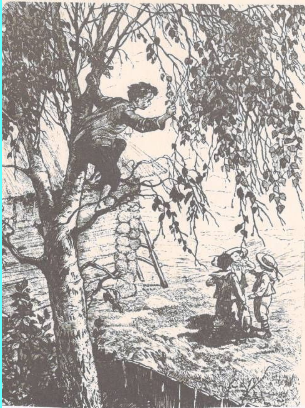
Алеша и дети Овсянников Алеша и Хорошее дело