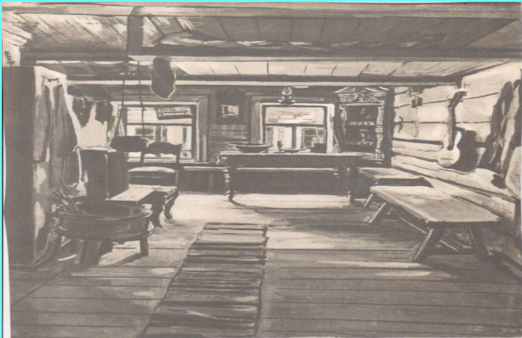
Дом В. В. Каширина (кухня) Бытовой музей детства А. М. Горького в городе Горьком Художник И. А. Соколов. 1950 г.