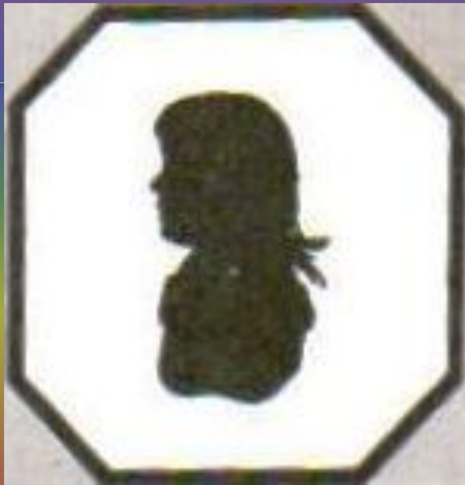
Мария Николаевна Волконская в детстве, мать Л.Н.Толстого.