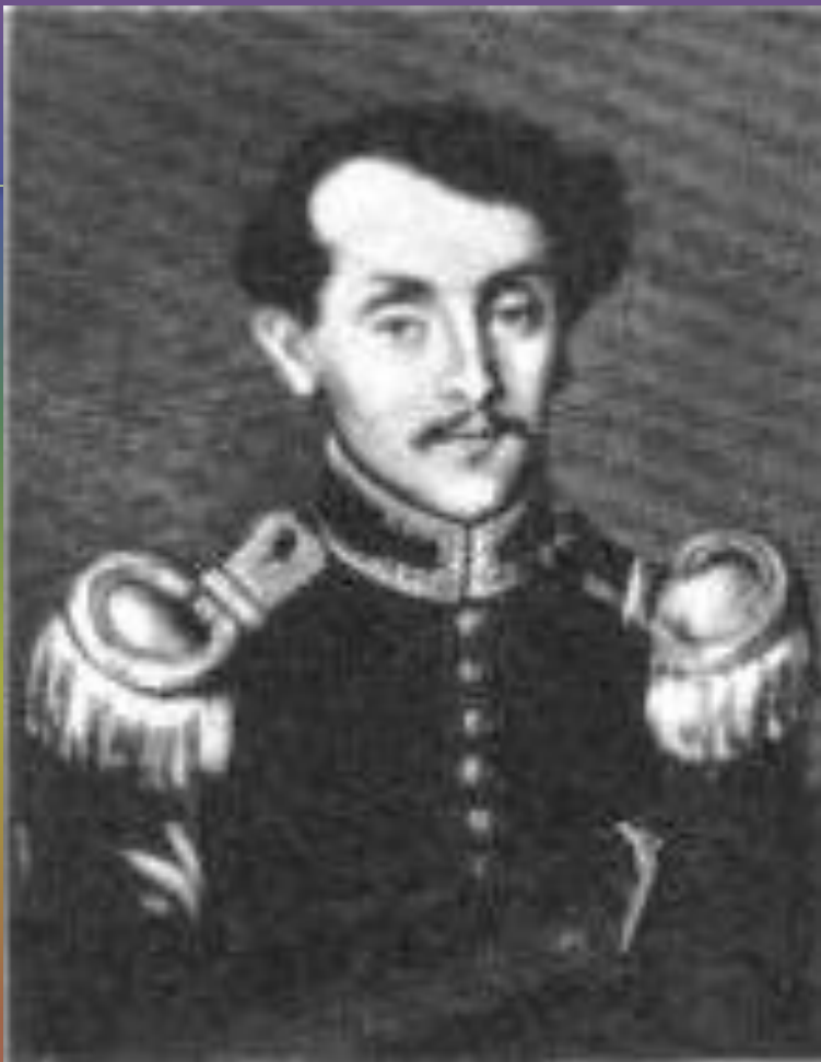
Николай Ильич, отец Л.Н.Толстого