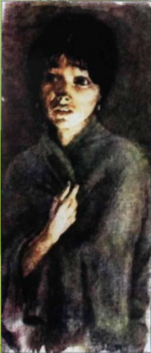
Иллюстрация В.М.Зельдес к повести И. С. Тургенева «Ася». 1982