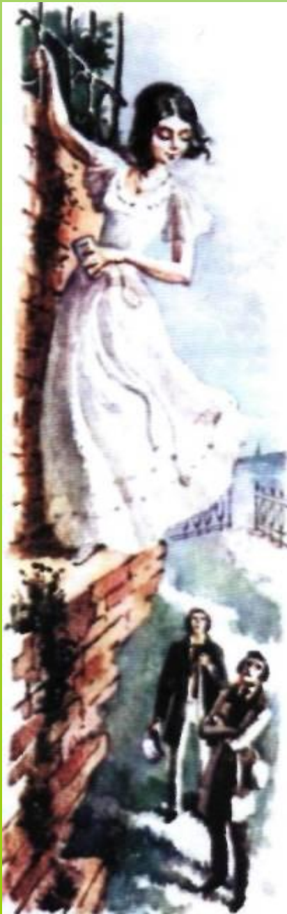
Иллюстрация В.М.Зельдес к повести И. С. Тургенева «Ася». 1982