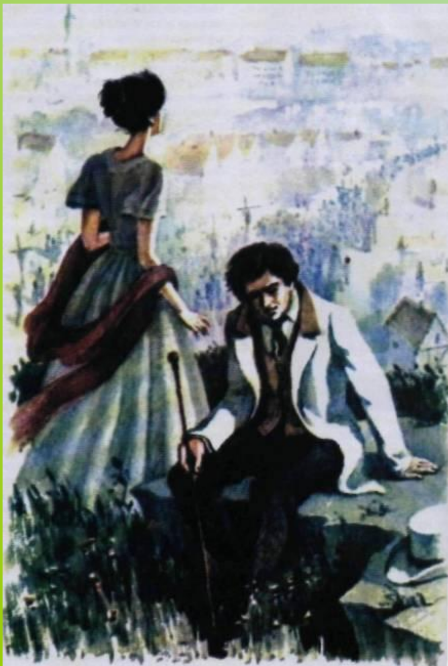
Иллюстрация В.М.Зельдес к повести И. С. Тургенева «Ася». 1982