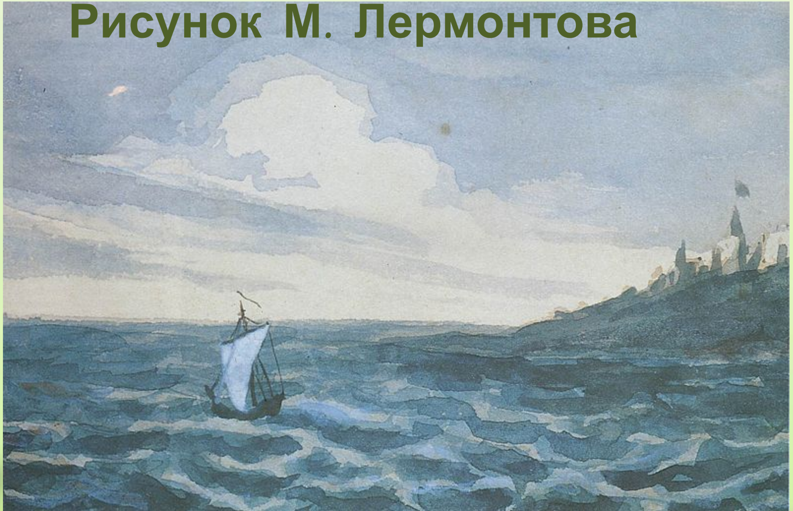
Рисунок М. Лермонтова