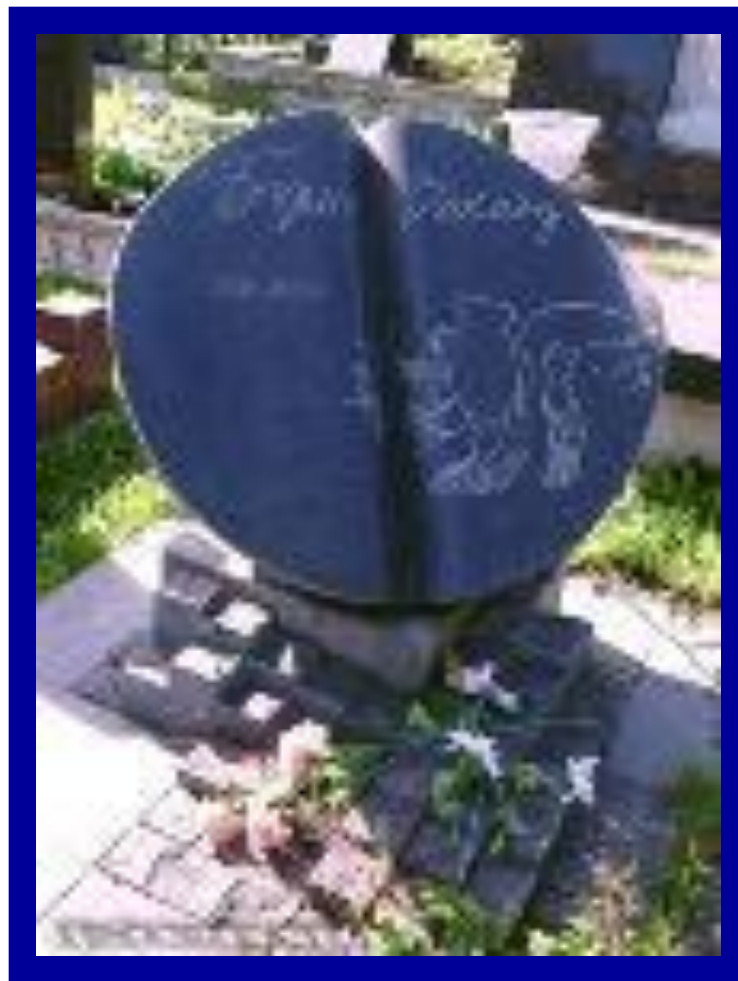
Могилу Бориса Владимировича Заходера