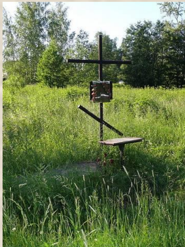
Крест-кенотаф в вероятном месте расстрела Н. С. Гумилева. Бернгардовка (долина реки Лубьи)