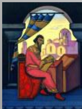
Ярослав Мудрый (Н. К. Рерих)