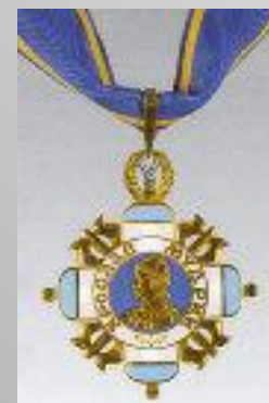
Ярослав Мудрый (Н. К. Рерих)