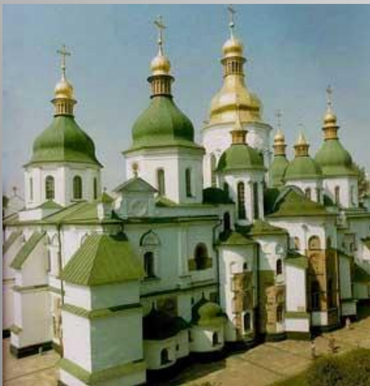
Софийский собор в Киеве