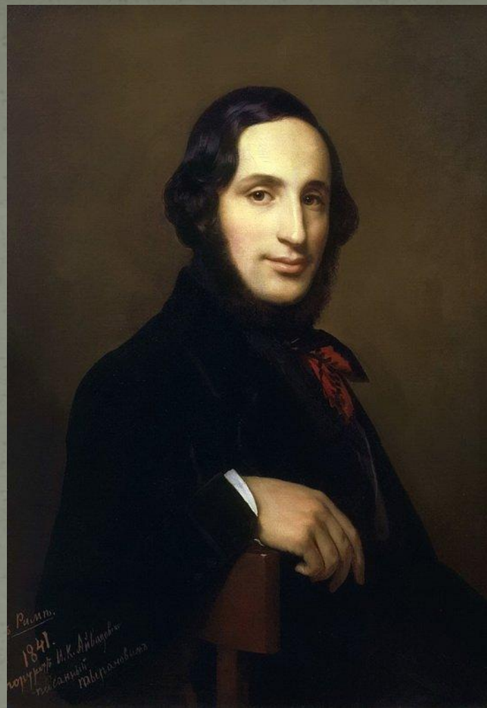
И. К. Айвазовский.

Вот уже более ста лет творчество Ивана Константиновича Айвазовского (Гайвазовского) вызывает глубокий интерес и чувство восхищения у людей, самых различных по возрасту, профессии и душевному складу. Выдающийся художник второй половины прошлого века, Айвазовский и в наши дни остается одним из самых популярных мастеров русской школы. Иван Константинович родился и вырос на берегу моря, и вполне естественно, что именно морю отдал художник свою любовь, морю посвятил свое творчество. Но море было не единственным стимулом, определившим рождение покоряющего искусства Айвазовского. Важнее было другое — то, что в натуре Айвазовского, в складе его мышления и чувствования, во всем его характере были такие черты, сочетание которых с особенностями дарования породило исключительное своеобразие его творчества.