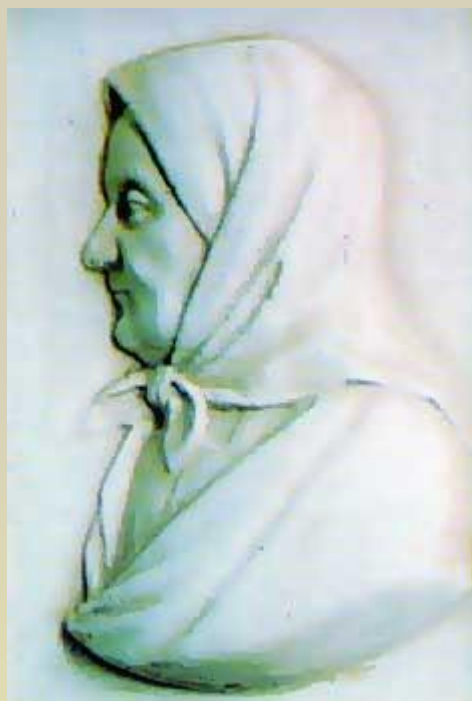
Я.П. Серяков Барельеф Арины Родионовны Работа по кости 1840-е гг.

Любовь ему компенсировала знаменитая няня Арина Родионовна