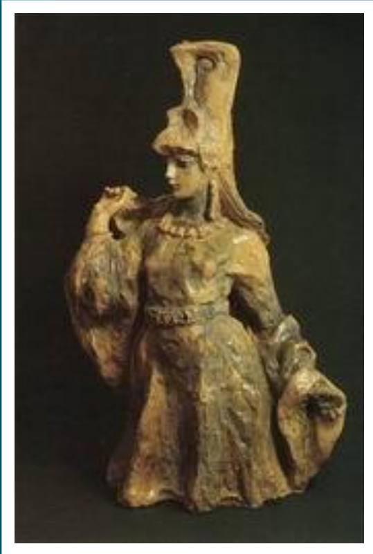
Загадочная и обворожительная Волхова