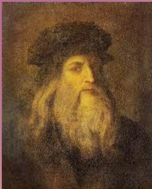
Леонардо да Винчи