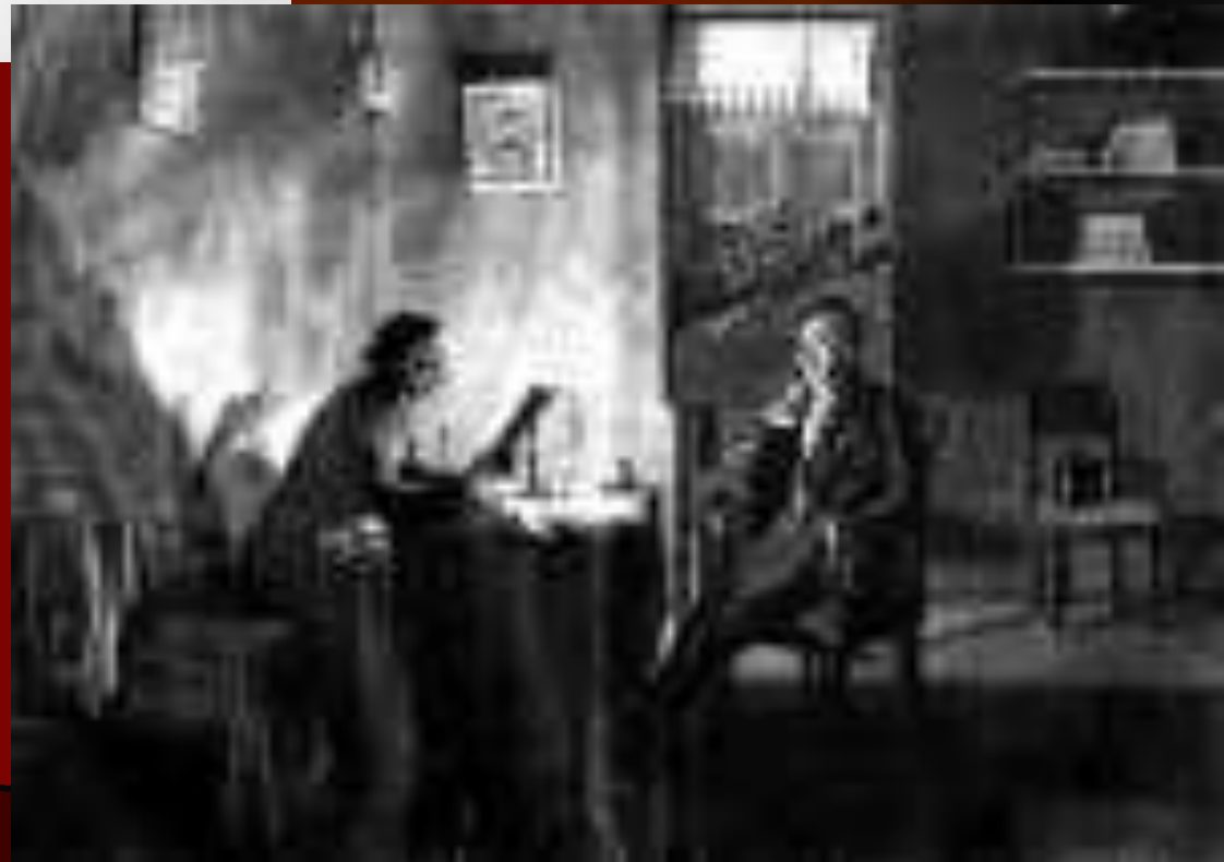
Пушкин у Гоголя