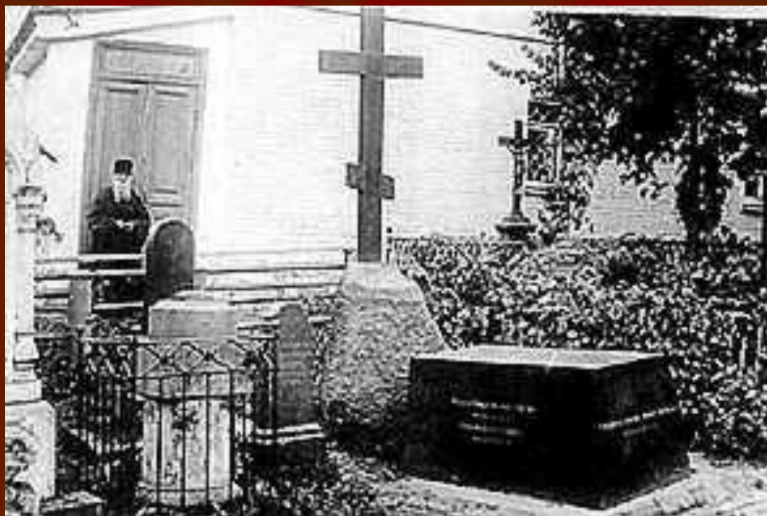
Бывшая могила Н.В. Гоголя в Свято-Даниловом монастыре в Москве

Похороны писателя состоялись при огромном стечении народа на кладбище Свято-Данилова монастыря, а в 1931 останки Гоголя были перезахоронены на Новодевичьем кладбище.