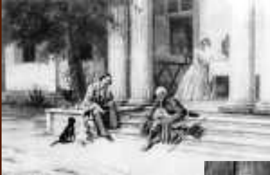
Н.В. Гоголь в Яновщине