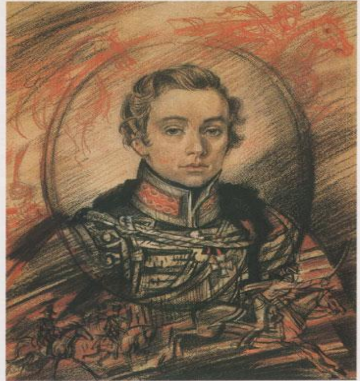
Надежда Андреевна Дурова 1783—1886

Нашествие Наполеона вызвало небывалый патриотический подъем в русском обществе. Во всенародную борьбу с захватчиками входили представители всех слоев населения. Сохранилась память и о героинях той поры.