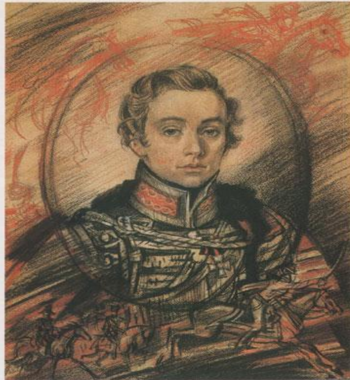
Надежда Андреевна Дурова 1783—1886

Нашествие Наполеона вызвало небывалый патриотический подъем в русском обществе. Во всенародную борьбу с захватчиками входили представители всех слоев населения. Сохранилась память и о героинях той поры.