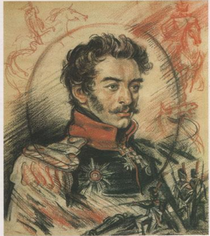
Сергей Григорьевич Волконский 1788—1865

• Волконский начал службу в 1806 году поручиком кавалергардского полка. Тогда же началась боевая жизнь в качестве адъютанта Остермана-Толстого.