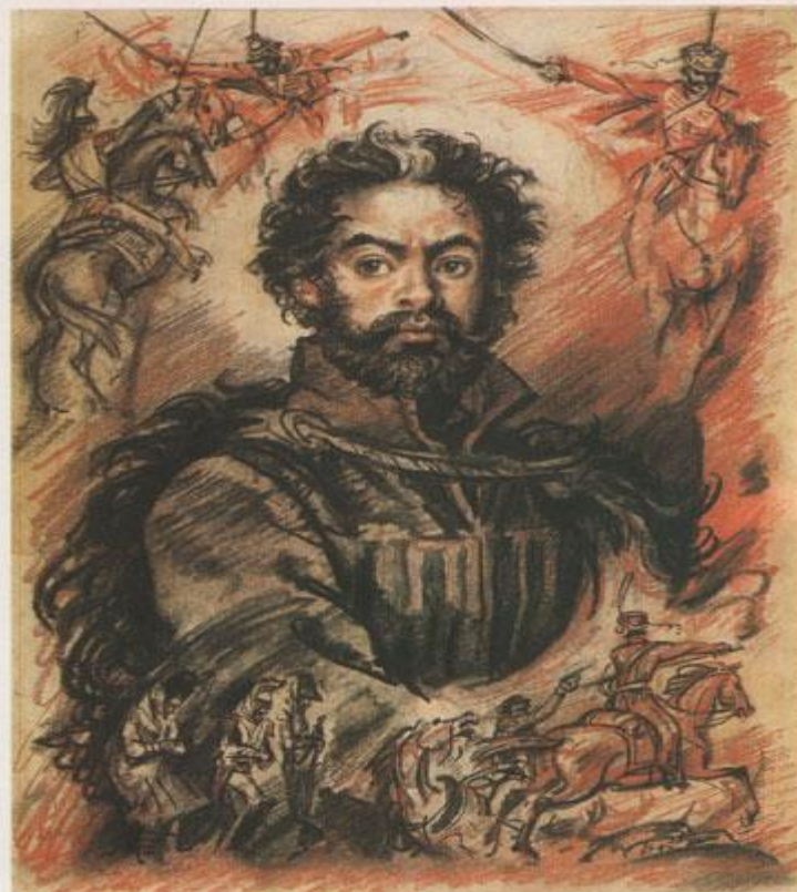
Денис Васильевич Давыдов 1784—1839

«Я был рожден для рокового 1812 года», — писал в автобиографии прославленный поэт-партизан. Денис Васильевич Давыдов, сын командира Полтавского конного полка, в семнадцать лет начал военную службу эстандарт-юнкером в кавалергардском полку, а затем в армейском Белорусском гусарском полку.