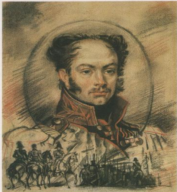
Михаил Федорович Орлов 1788—1842