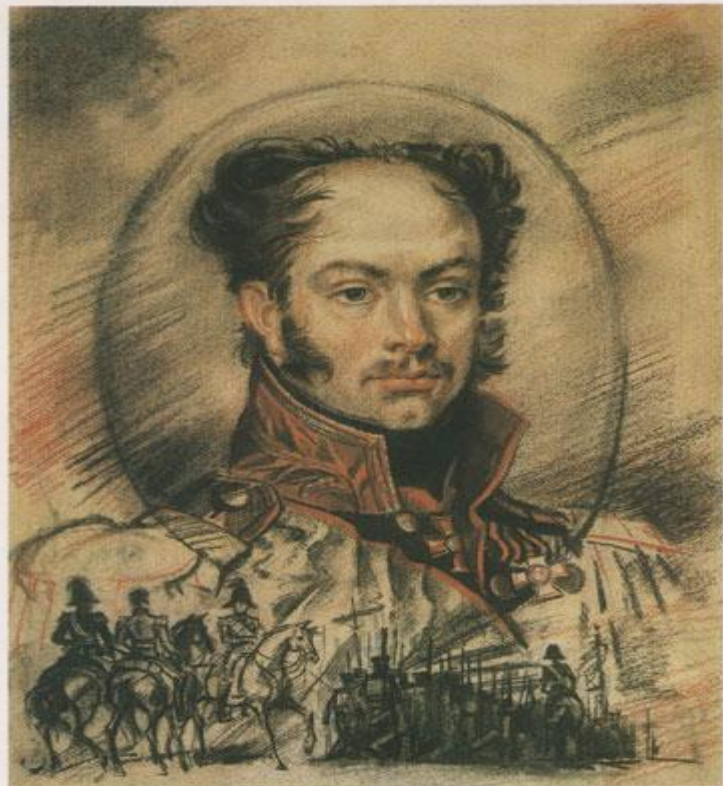
Михаил Федорович Орлов 1788—1842