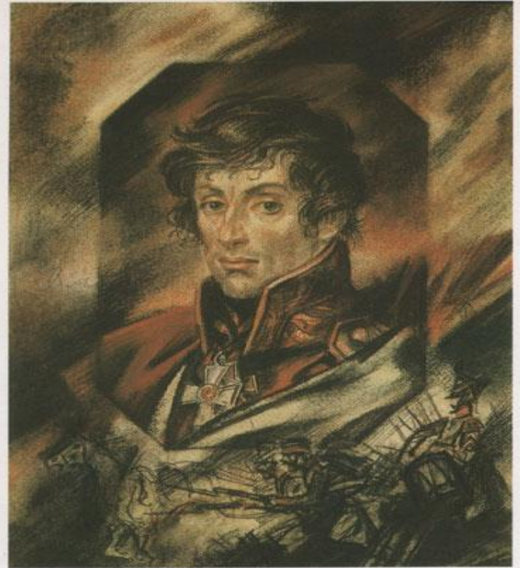
Александр Иванович Остерман-Толстой 1770—1857

Остерман-Толстой начал военную службу при Суворове. Участвовал в штурме Измаила. В кампании 1806—1807 годов отличился в бою у местечка Черного, удерживая позиции в течение 15 часов против Наполеона. Героически сражался под Пултуском и Прейсиш-Эйлау.