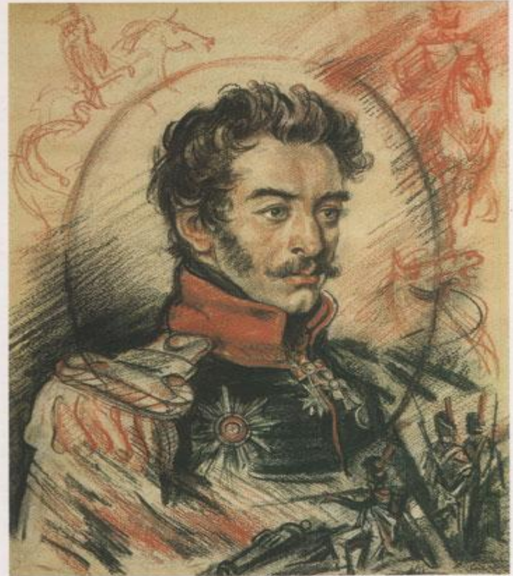
Сергей Григорьевич Волконский 1788—1865

• Волконский начал службу в 1806 году поручиком кавалергардского полка. Тогда же началась боевая жизнь в качестве адъютанта Остермана-Толстого.