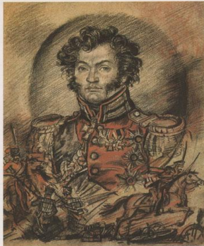
Федор Павлович Уваров 1769—1824

В 27 лет был произведен в генералы. Участвовал в кампаниях 1805—1807 годов и в сражениях на Дунае в 1810 году.