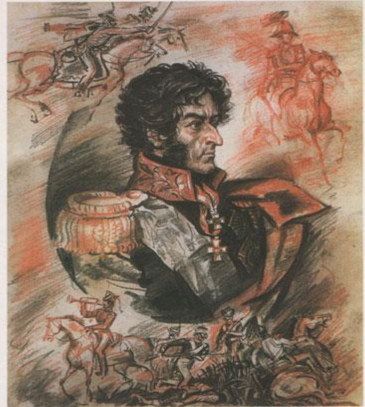
Петр Иванович Багратион 1765—1812

«Багратион — лучший генерал русской армии», — говорил Наполеон. Участник штурма Очакова, Варшавы, Багратион проделал с Суворовым весь Итальянский поход, был его правой рукой. Взятие Брешины, Бергамо, Лекко, Тортоны, Турина и Милана, битва при Треббии, при Нови — везде Багратион находился в самых трудных и решающих местах. Знаменитый Швейцарский поход Суворова принес славу и Багратиону, проявившему героизм, хладнокровие, волю к победе.