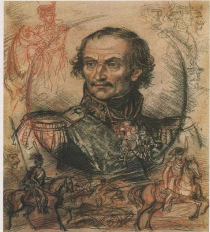
Матвей Иванович Платов 1751—1818